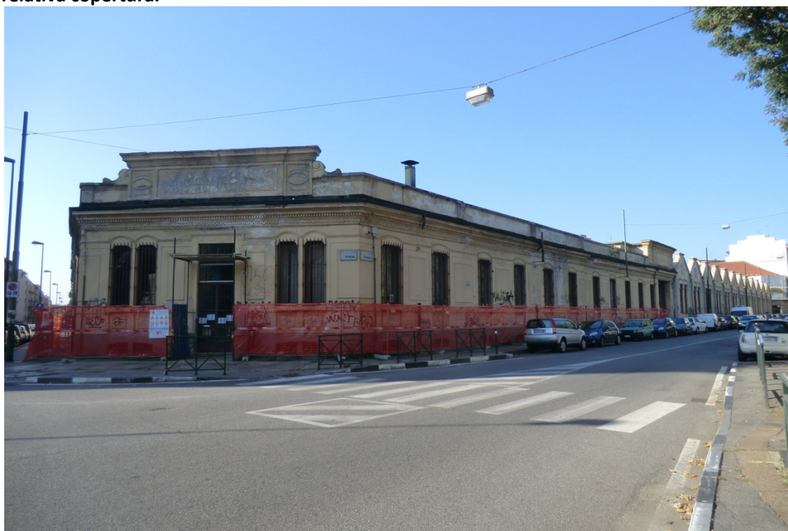
Figura 3. Vista dell'area Diatto – Snia Viscosa al termine delle demolizioni dall'angolo tra via Cesana e via Moretta. Si può osservare il mantenimento del muro perimetrale e della relativa copertura.