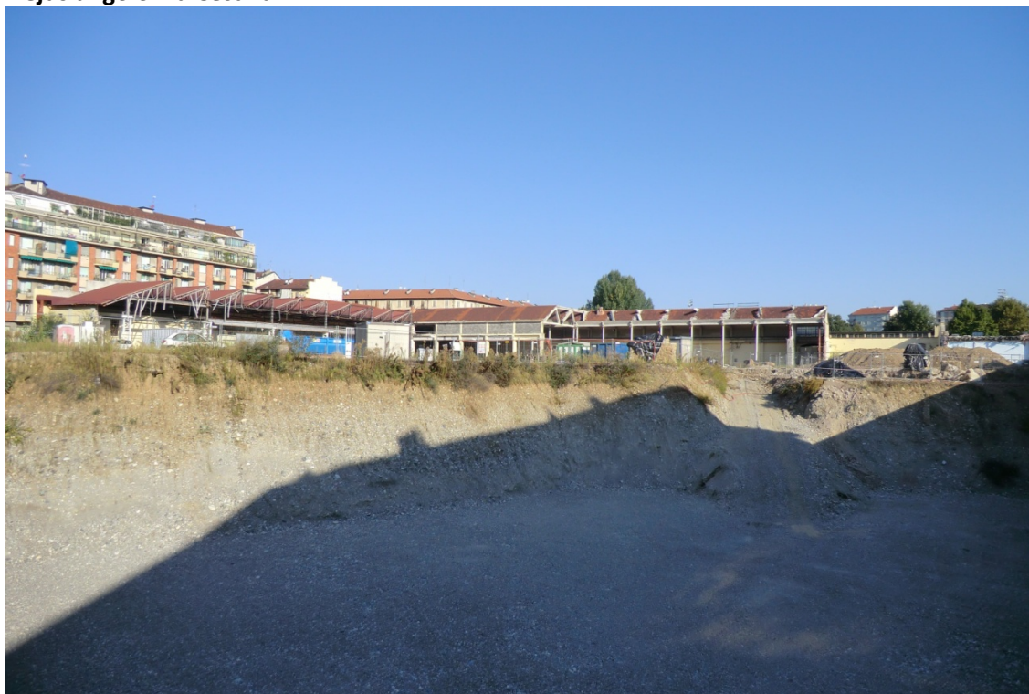
Figura 2. Vista della palazzina uffici e del muro perimetrale della Diatto – Snia Viscosa da via Frejus angolo via Cesana