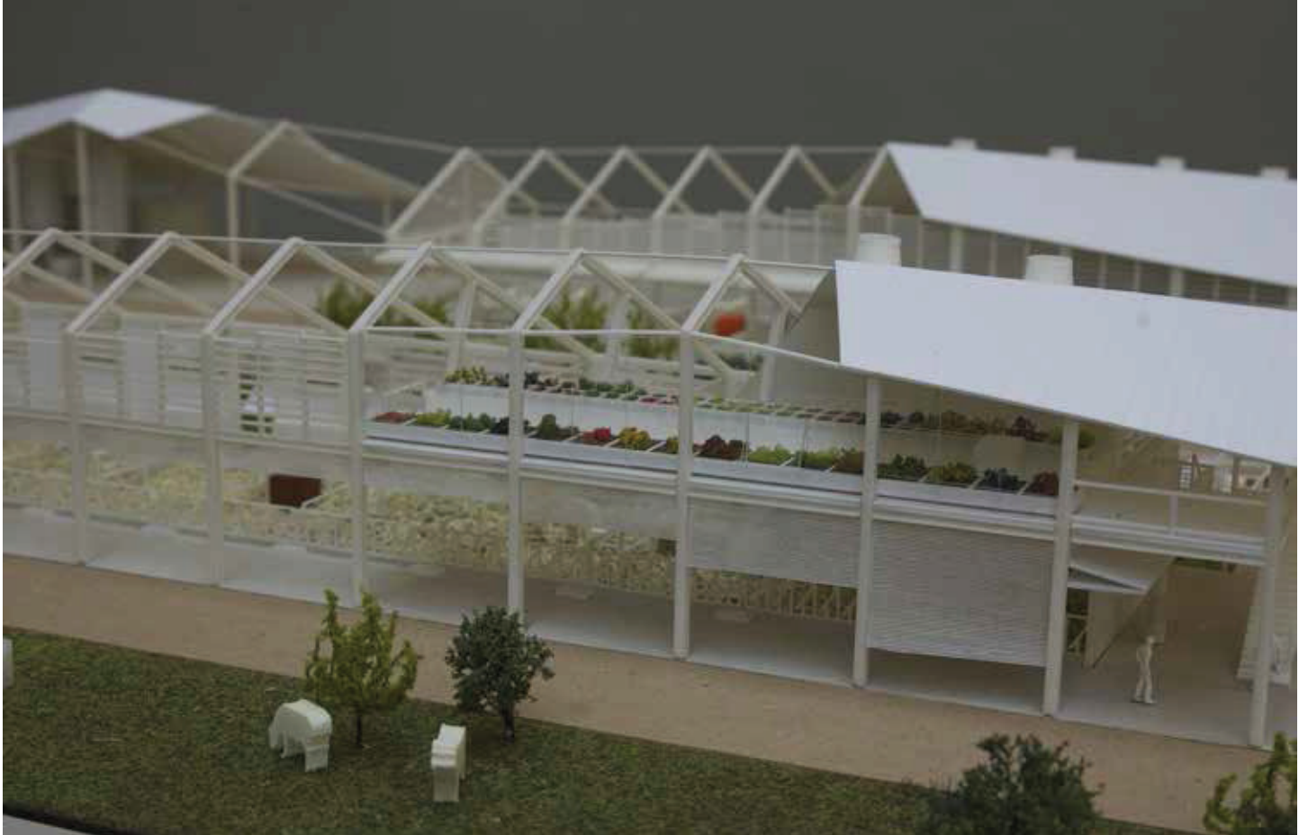
Plastico della stalla sostenibile. In alto: vista generale. In basso: dettaglio.