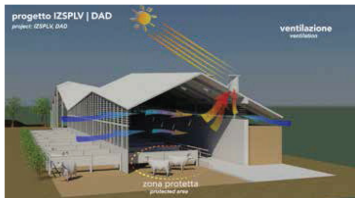
Ventilazione naturale della stalla attraverso camino solare. È necessario garantire il ricambio dell'aria interna mantenendo i bovini in un'area protetta, non esposta a correnti dirette.

I risultati dello studio per una stalla sostenibile realizzato in occasione delle attività legate a Expo 2015 aprono la strada a nuove prospettive di ricerca interdisciplinare con possibili ricadute sul paesaggio agrario montano e pedemontano e forti legami con il nuovo Programma di Sviluppo Rurale della Regione Piemonte.