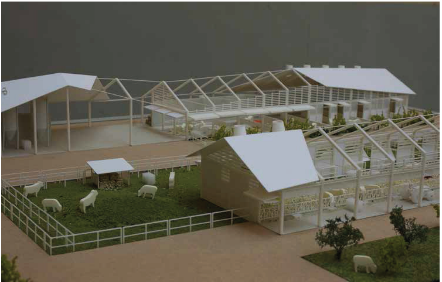
Plastico della stalla sostenibile.

Il progetto, data la complessità del tema, ha richiesto il coinvolgimento di competenze specifiche e ha portato, come primo risultato, alla proposta di un "modello" di stalla sostenibile per l'allevamento di bovini da carne di razza piemontese, in cui si ottimizzano aspetti funzionali legati all'approvvigionamento e allo stoccaggio dei mangimi, alla gestione dei pascoli, al benessere animale e alla pulizia degli ambienti di stabulazione.