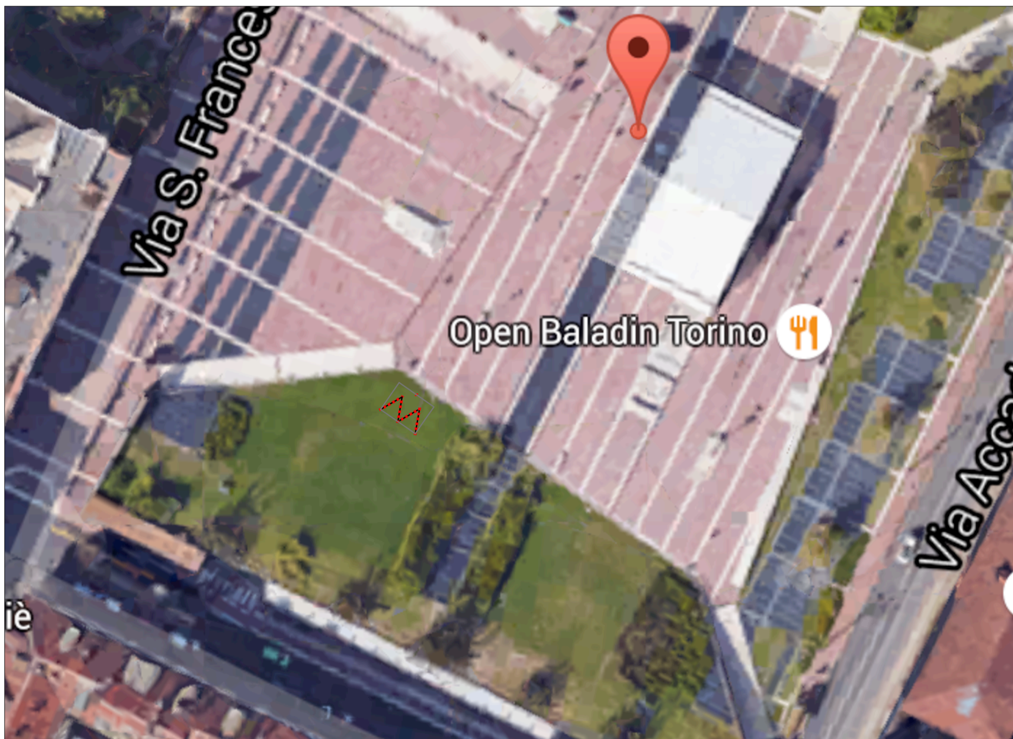
Vista satellitare di piazzale Valdo Fusi, con l'indicazione dell'area occupata dalla nostra installazione.

L'installazione proposta da momowo per il Festival dell'Architettura si situa sul lato Sud Ovest del piazzale Valdo Fusi, occupando una superficie complessiva di circa 14 mq. Su questa superficie verranno piantate da 22 a 25 asticelle da giardino (per una profondità max di 10 cm) che sosterranno dei leggeri pannelli in formato A5 mostranti i QRcode relativi a una serie di opere di donne architetto e designer in Torino.