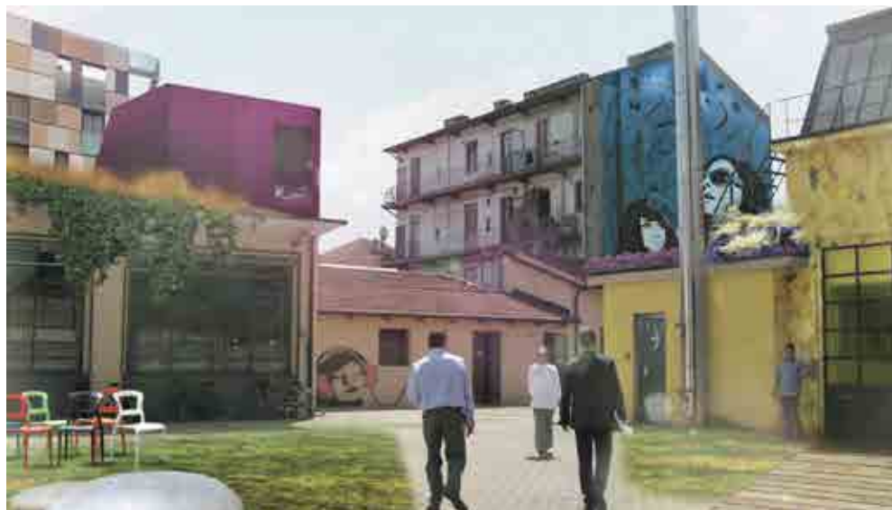
Fig.2 ToMake – masterplan della Variante 200, Studio TRA, Immagine di progetto 2. Torino, 2012. © TRA

può essere in grado di assecondare la compresenza di usi e di utenti attraverso uno spazio accessibile a tutti e semplice anche in termini tecnici, in questo vi è il grande compito dell'architettura. E' necessario ricominciare a studiare, ad esempio, delle pavimentazioni, degli spazi resistenti, resilienti, durevoli che richiedono poca manutenzione, croce dello spazio pubblico iperdecorato degli anni '80: pensiline da verniciare, cubetti in porfido da rimettere ogni volta al loro posto, cestini da raddrizzare. Sono bellissime quelle infilate di paletti in acciaio inox che sono state realizzate in molte città italiane, basta che se ne urti uno, che immediatamente lo spazio appare degradato, probabilmente quella non è una buona soluzione, quindi vedo una dimensione tecnica dello spazio pubblico che appartiene completamente all'architettura, e che deve però accettare di essere tecnica e non espressiva. Lo spazio pubblico non è il luogo dove l'architetto è chiamato ad esprimere le proprie personali idiosincrasie, sono invece luoghi dove è chiamato a dare forma e tecnica, a risolvere tecnicamente il problema di uno spazio accogliente, resistente, al fine di ottenere una sorta di lavagna dove poi generazioni, popolazioni e gruppi possano scrivere i loro testi, cancellarli e riscriverli nuovamente, senza che la cornice o il quadro cambi.