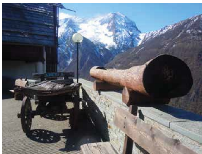
Apposizione di elementi di arredo pseudo montano nel contesto moderno (Sauze di Cesana, alta valle Susa).

Fattori che emergono per favorire il riconoscimento dell'identità e l'appropriazione alla scala micro-territoriale sono la leggibilità dei caratteri di paesaggio, l'integrazione dei fronti, la ricucitura delle aree di transizione tra infrastrutture veicolari e spazio di loisir e tempo libero, la messa in evidenza dei luoghi emblematici e degli accessi, la plurifunzionalità degli arredi. In un approccio di local re-branding , la riprogettazione degli spazi aperti e dei servizi riguarda, nel complesso, l'integrazione dell'immagine, il miglioramento dell'ambiente climatizzante, la dotazione di strutture per il benessere e di loose space , l'inserimento di elementi testimoniali e di arte pubblica. Lo spazio simbolico della piazza costituisce uno scenario principale di sperimentazione con i materiali delle diverse tradizioni montane, nella sostenibilità e nella ri-creazione del locale.