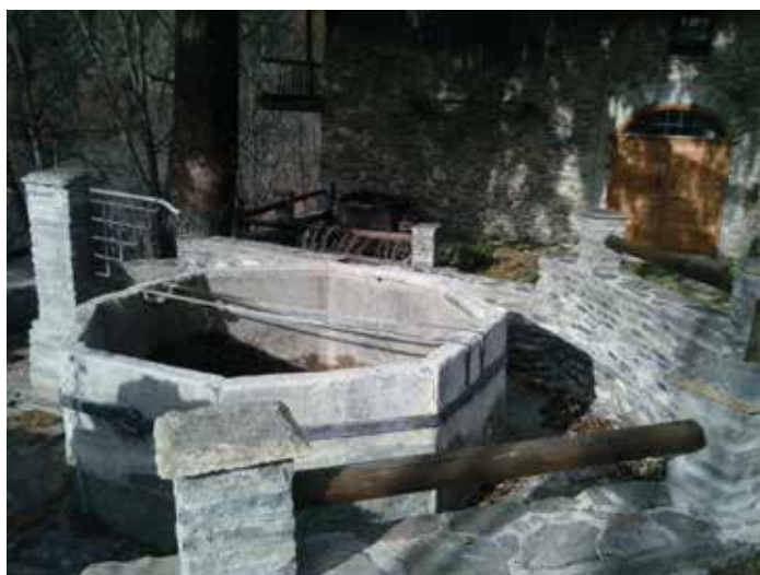
Recupero del sito pubblico tradizionale (Desert, alta valle Susa).

La mise en scène dello spazio pubblico deve considerare innovazione e rafforzamento dell'identità locale; anche i caratteri fondativi della nuova montagna dello sci degli anni cinquanta-settanta – l'ambiente incontaminato e le piste innevate in diretta relazione con la residenza a Sansicario, Courchevel, Marilleva ecc. – non sono più intrinsecamente sufficienti a rispondere all'evoluzione della domanda.