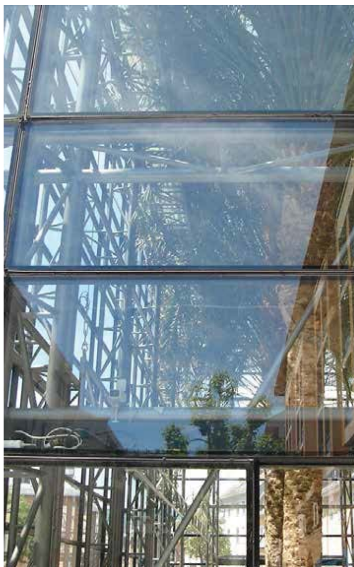
Serra climatizzata come spazio pubblico (Chambery, alta Savoia).