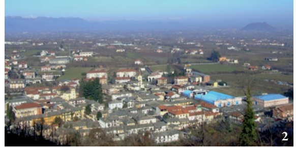
1. Il borgo vecchio e la chiesa di San Giovanni Battista, ripresi dalla salita al Castelnuovo superiore. 2. La trama regolare del borgo inferiore, vista dal Castelnuovo superiore; a destra la rocca di Cavour.