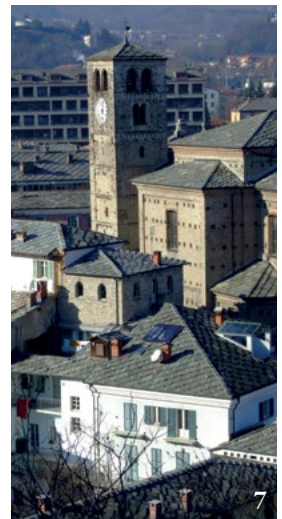
3. Mappa del catasto settecentesco (ASTo, Cat. ant., All. C, Barge, tavola E). 4. Via Maestra, edifici porticati medievali. 5. Via Maestra, edifici porticati medievali. 6. Via Maestra, edifici porticati medievali. 7. La casa forte sulla via Maestra a sud della chiesa di San Giovanni Battista. 8. Strada del borgo inferiore. 9. Castello inferiore. 10. Castello superiore.