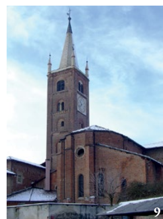
3. Il sito di Villafranca, segnato dal campanile trecentesco di Santo Stefano, ripreso da oltre il Po, dalla strada per Moretta. 4. Asse retto del borgo di Musinasco (via Matteotti), ripreso verso il ponte sul Po. 5. Case porticate lungo l'asse retto, lato nord. 6. Asse principale di borgo Soave (via Roma), ripreso da ovest. 7. Strada dell'impianto regolare di borgo Soave (via Roppolo). 8. Casa medievale lungo l'asse retto di Musinasco, lato nord. 9. Santo Stefano, abside e campanile.