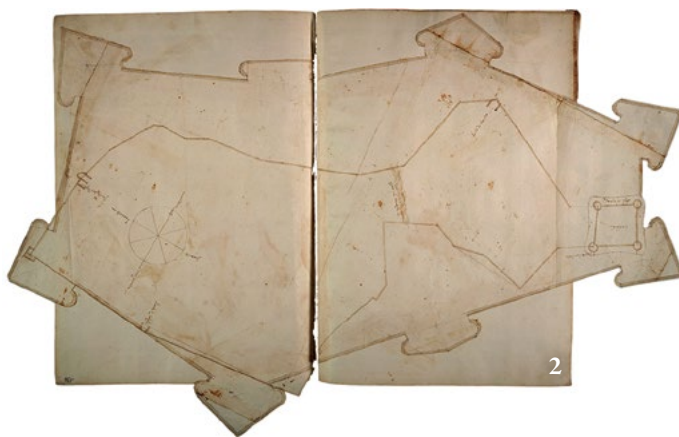
1. Mappa catastale (ASTo, Cat. franc., Villafranca, All. A, pf. 55, copia di mappa particellare settecentesca). 2. Il perimetro fortificato medievale rilevato in occasione di un progetto di bastionatura (ASTo, Bibl. ant., Arch. mil. , vol. V, f. 195v-196).