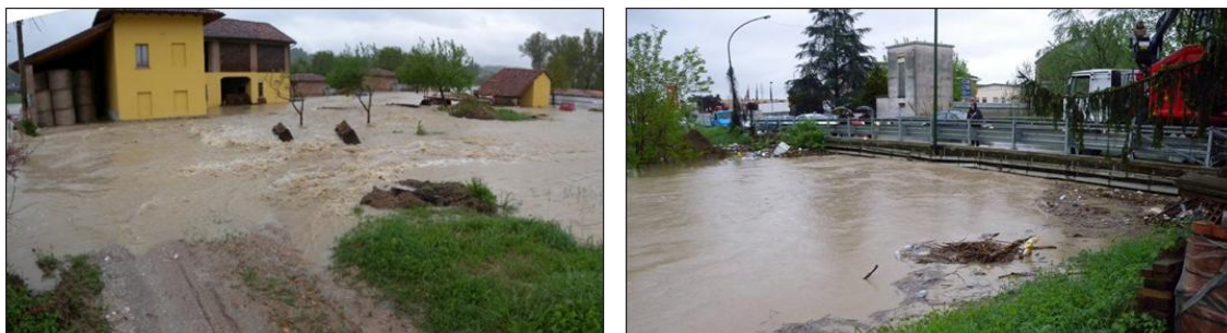
Figura 1: Cascina Gala (Comune di Castell'Alfero) e Ponte di C.so Alessandria (Comune di Asti) - Evento del 27 aprile 2009

La necessità di realizzare dei modelli realistici di simulazione delle piene e di sviluppare l'analisi di fattibilità per interventi di mitigazione della pericolosità idraulica, scaturisce pertanto dalle sempre più frequenti esondazioni del torrente Versa che, sia storicamente che attualmente, stanno coinvolgendo importanti aree (urbanizzate e non), causando al contempo l'interruzione di importanti arterie viarie di collegamento.