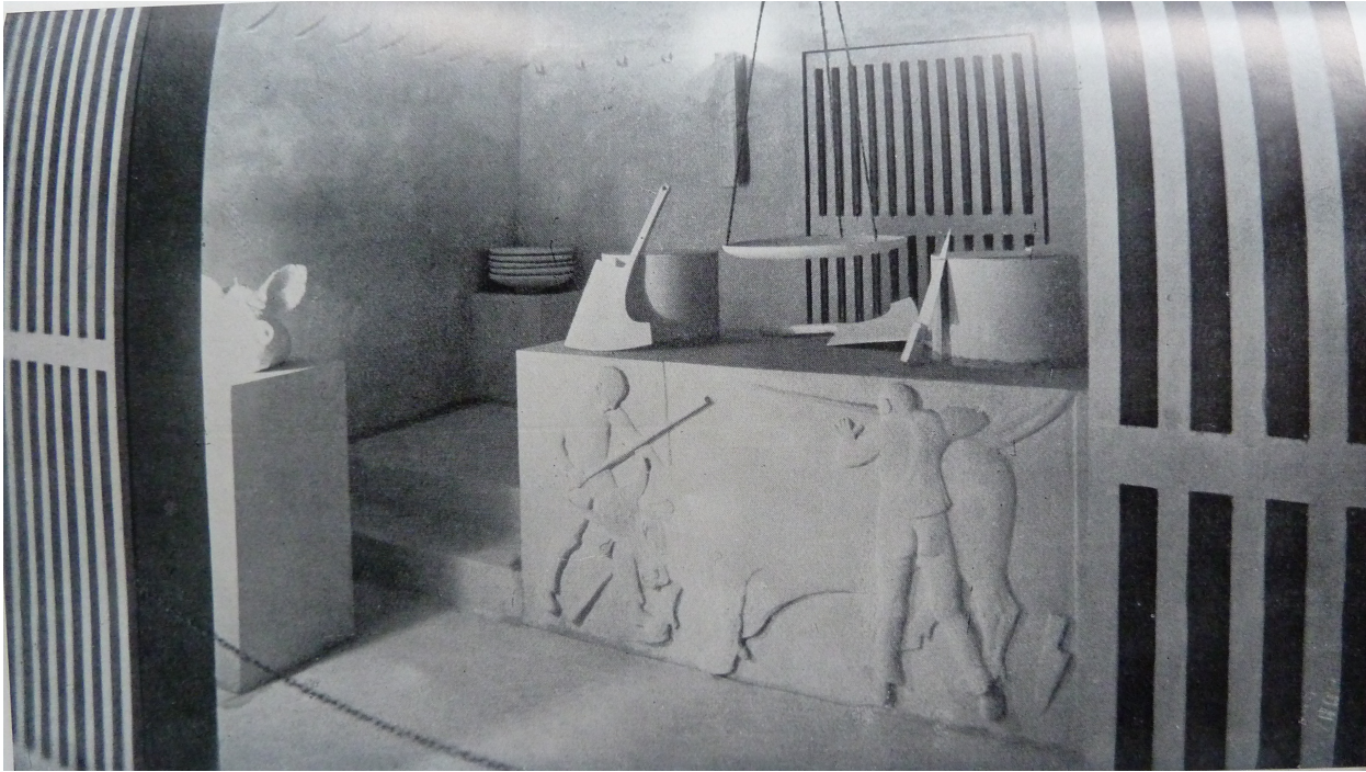
Felice Casorati, Macelleria alla Biennale di Monza, 1927, Sezione Piemontese

La direzione tracciata, più o meno consapevolmente, dalla via dei negozi piemontese alla Biennale, prosegue essenzialmente sulla scorta di un concetto molto pragmatico: i negozi sono soprattutto una faccenda di comunicazione. Non a caso la sequenza cibo (industrializzato o semindustrializzato), progettista e ricerca di un'immagine forte avviene proprio in occasione dell'insediamento di locali commerciali direttamente commissionati dalle aziende.