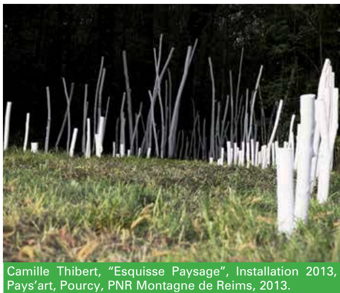
Camille Thibert, "Esquisse Paysage", Installation 2013, Pays'art, Pourcy, PNR Montagne de Reims, 2013.

dei parchi, o di tipo stabile e continuativo, nell'ambito di piani di riqualificazione paesaggistica e di risviluppo di distretti naturalistico-culturali.