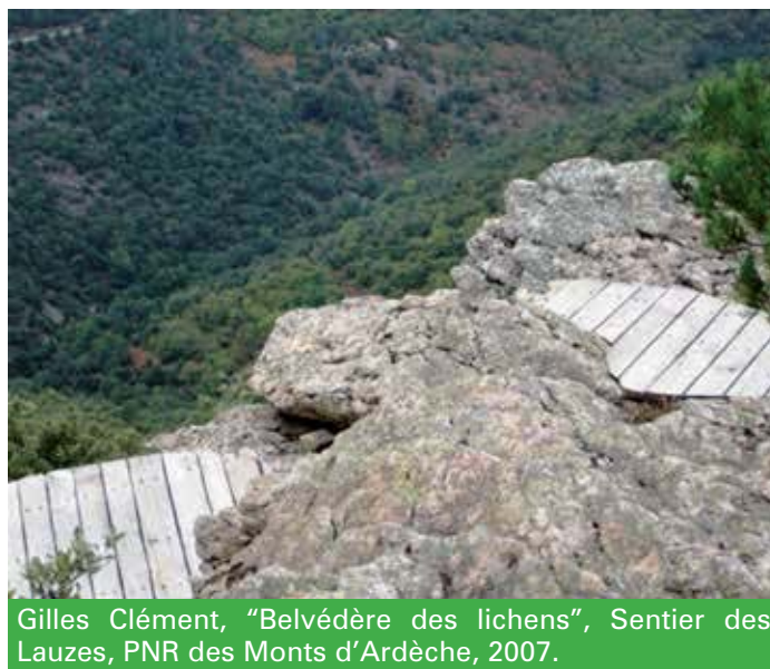
Gilles Clément, "Belvédère des lichens", Sentier des Lauzes, PNR des Monts d'Ardèche, 2007.

La reinterpretazione delle forme semplici della natura del luogo, fino a un'essenzialità quasi astratta nella prospettiva della land art , è centrale nelle pratiche artistiche effimere attraverso manifestazione occasionali o annuali, in molti parchi francesi. Nel cammino ad alta quota "Quatre" (2012) – fra Briançon, Château-Queyras, Les Vigneaux, Mont-Dauphin – nelle aree protette delle storiche fortificazioni del Queyras, nelle Hautes-Alpes, i land-mark ambientali sono creati da quattro artisti con materiali in situ, stimolano una riscoperta della storia e dell'architettura del territorio, comune ad abitanti e turisti.