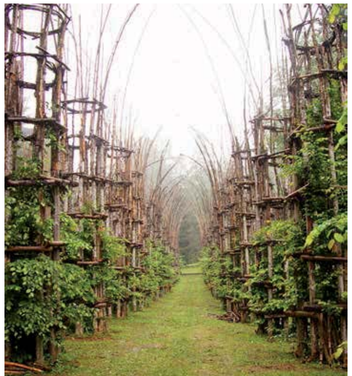
Giuliano Mauri, "Cattedrale Vegetale", Arte Sella 2002, disegno preparatorio, immagine.