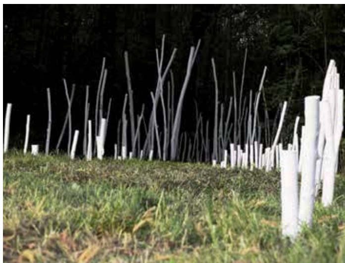
Camille Thibert, "Esquisse Paysage", Installation 2013, Pays'art, Pourcy, PNR Montagne de Reims, 2013.

dei parchi, o di tipo stabile e continuativo, nell'ambito di piani di riqualificazione paesaggistica e di risviluppo di distretti naturalistico-culturali.