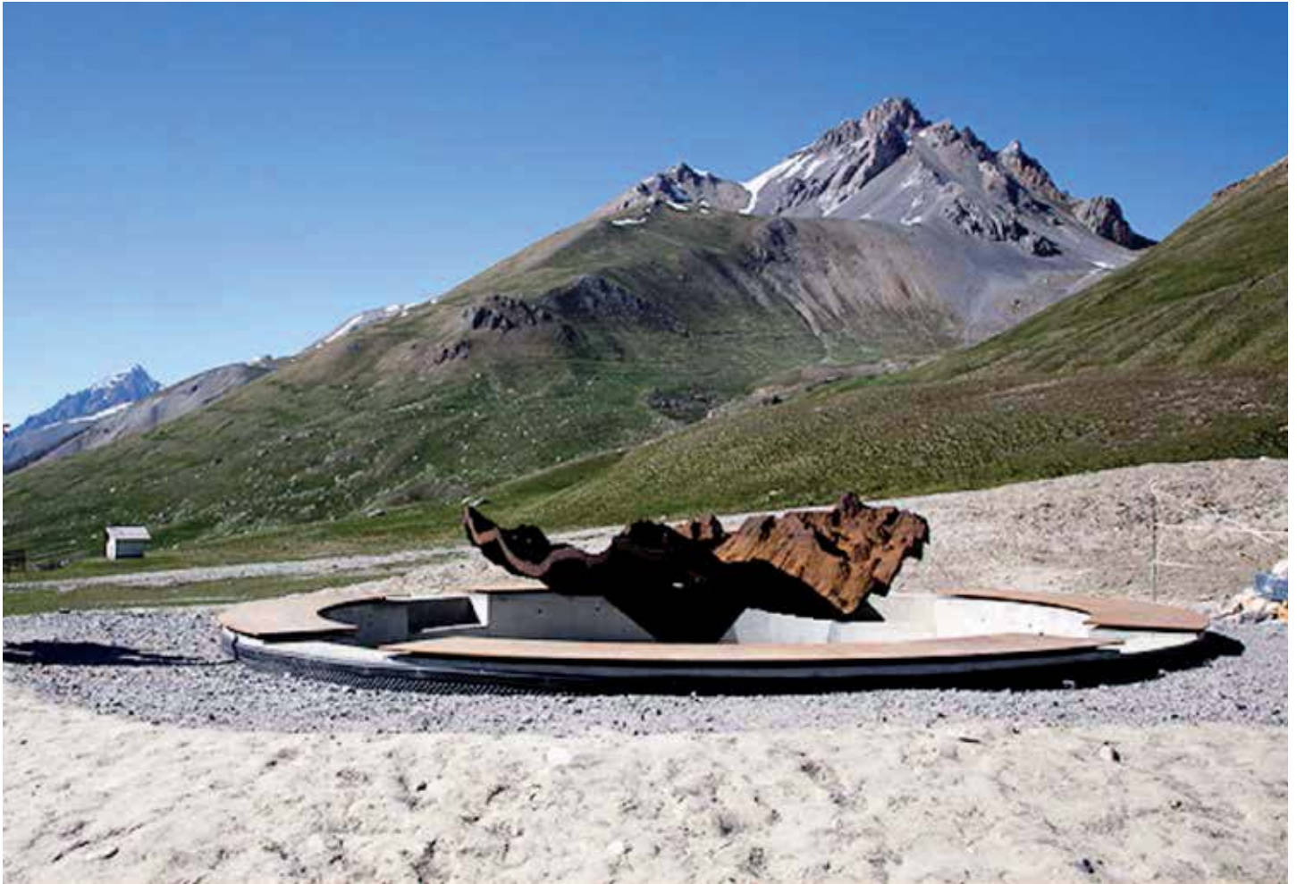
David Renaud, "Table Relief", VIAPAC Via per l'Arte Contemporanea, Col de Larche, Alpes de Hautes Provence, 2012.

e porta la riflessione sul complesso rapporto uomo-ambiente, prospettando un approccio non limitato alla dimensione del parco.