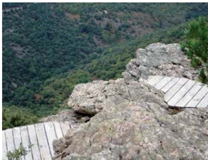
Gilles Clément, "Belvédère des lichens", Sentier des Lauzes, PNR des Monts d'Ardèche, 2007.

La reinterpretazione delle forme semplici della natura del luogo, fino a un'essenzialità quasi astratta nella prospettiva della land art , è centrale nelle pratiche artistiche effimere attraverso manifestazione occasionali o annuali, in molti parchi francesi. Nel cammino ad alta quota "Quatre" (2012) – fra Briançon, Château-Queyras, Les Vigneaux, Mont-Dauphin – nelle aree protette delle storiche fortificazioni del Queyras, nelle Hautes-Alpes, i land-mark ambientali sono creati da quattro artisti con materiali in situ, stimolano una riscoperta della storia e dell'architettura del territorio, comune ad abitanti e turisti.