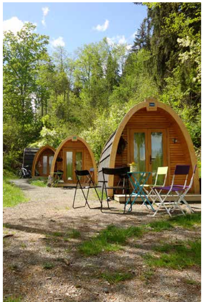
Pressebilder PODhouses.