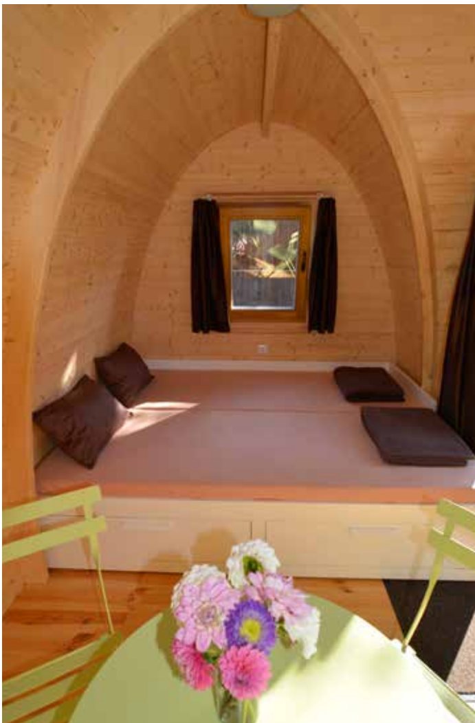
Pressebilder PODhouses (© Robust Outdoor Brands).

Tutti i bivacchi e i rifugi moderni sono autosufficienti dal punto di vista energetico: dotato di un impianto elettrico alimentato da pannelli fotovoltaici, ad esempio, è il bivacco Luca Vuerich, a quota 2531 m, realizzato nel 2012 sul Foronon del Buinz (progetto dell'architetto Giovanni Pesamosca). La struttura, in legno di abete rosso, sorge su una cresta rocciosa e poggia su pilastri in calcestruzzo; caratterizza il bivacco la conformazione a falde, adatta a sopportare i grossi carichi di neve, con copertura in lamiera. Tale conformazione ricorda il bivacco Sartore, del 2011, con struttura portante e interni in legno e copertura in lamiera rossa, ricorda anche il progetto della casa Capriata di Mollino e il rifugio Mollino costruito nel 2014 in Valle d'Aosta, a Weissmatten vicino a Gressoney Saint Jean (progetto di ricerca promosso del Dipartimento di Architettura e Design del Politecnico di Torino).