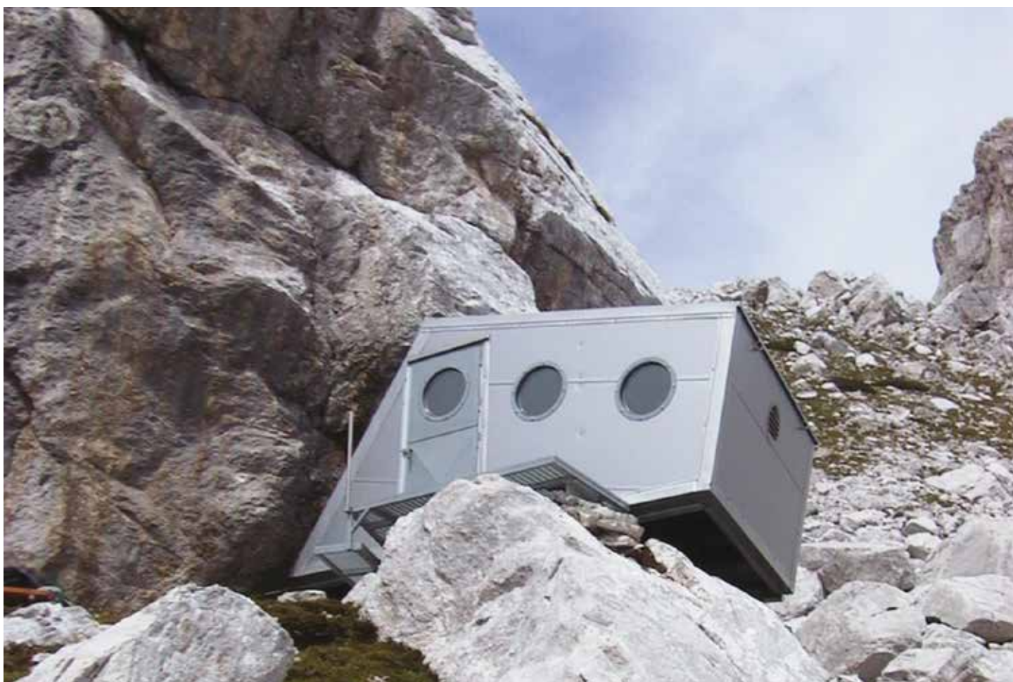
Bivacco al Kotovo Sedlo.