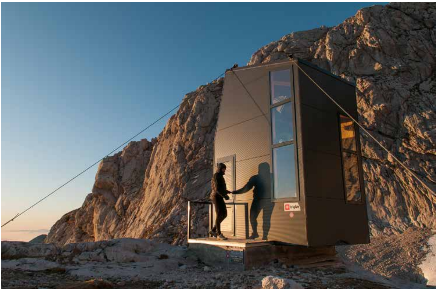
Bivacco sotto il Grintovec.

Nell'ambiente montano convivono oggi soluzioni altamente tecnologiche e strutture architettoniche che possono essere definite "low tech". Le nuove strutture ricettive alpinistiche, i rifugi e i bivacchi che di recente sono stati costruiti, utilizzano materiali e tecnologie innovative, d'avanguardia. Ne sono un esempio la nuova capanna Gervasutti, progettata da LEAPfactory, e il nuovo Refuge du Goûter, entrambi sul Monte Bianco, il rifugio Neue Monte Rosa-Hütte situato a quota 2883 m, i nuovi bivacchi, progettati dall'architetto sloveno Miha Kajzel, situati sotto il Grintovec, nella cornice delle Alpi di Kamnik e al Kotovo Sedlo, sulle Alpi Giulie, e il bivacco Luca Vuerich, sul Foronon del Buinz: i nuovi rifugi e bivacchi risultano innovativi non solo dal punto di vista materico-tecnologico, ma in particolare dal punto di vista delle strutture, dalle forme molto originali e molto varie, talora ben visibili nell'ambiente montano, talora mimetizzate nel paesaggio roccioso.