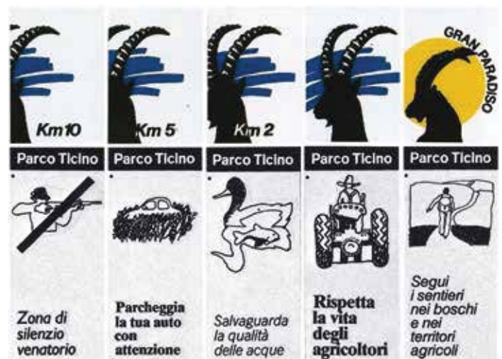
Parco Nazionale Gran Paradiso, segnaletica di avvicinamento (design Studio De Ferrari Architetti, 1983).

Negli anni a venire, i parchi naturalistici ospitano nuove occasioni di ecoturismo (mountain bike, sci alpinismo, ciaspole ecc.) alimentate e rese più attrattive da un organizzato design del servizio, da cui derivano anche nuove tipologie di arredo, ma non solo. L'allestimento di spazi a tema ne □ un esempio: si creano punti "osservatorio" sul paesaggio; luoghi per l'isolamento come il "pensatoio" o, all'opposto, per la condivisione, vedi il "pic/nic"; percorsi didattici, dedicati alla natura e allo sport, e calibrati in particolare sulle esigenze delle utenze deboli quali i bambini, gli anziani e i portatori di handicap. All'apertura sul sociale si accompagna una maggiore sensibilità verso il contesto territoriale, che si traduce in una visita arricchita dal contatto con le espressioni della cultura materiale (artigianato, costume, cucina) e della cultura del sostenibile. Diventa importante comunicare al visitatore, da un lato la salvaguardia di valori, come l'uso di materiali locali ad esempio (nel legno le specie autoctone), dall'altro rendere percepibili, qualora esistano, le recenti attività di miglioramento dei processi di produzione, oppure riconducibili alla filiera corta e all'approccio sistemico, pratica secondo cui ogni scarto può diventare risorsa. Ma, non cambia tanto il linguaggio