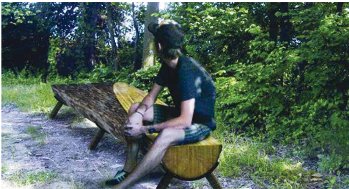
Sedili ricavati da tronchi in abbattimento per cause naturali, sagomati per modi diversi di seduta.