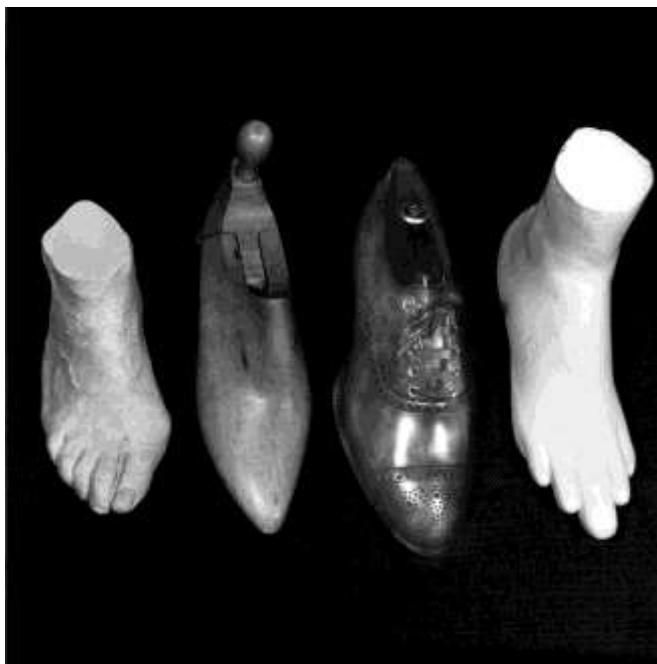
Fig. 1. Esta fotografía de Barbara Sutro para la exposición y el libro Are Clothes Modern? expresa quizá mejor que cualquiera otra la evidencia de la responsabilidad de los diseñadores, que crean sus obras no pensando en la realidad de los seres humanos sino en modelos ficticios.

La cuestión de la modernidad no es solo de la racionalidad formal, o de comodidad. Rudofsky basaba la necesidad de un enfoque diferente de la vivienda y del vestido también, o sobre todo, en la salud y en la felicidad: en resumen, en el equilibrio psicofísico. Pensaba que era inútil abordar el proyecto (o la elección de compra) sin plantearse radicalmente la cuestión de cuáles son las necesidades. Esto no significa, sin embargo, que Rudofsky no fuera consciente de las fuerzas que apartaban de tal enfoque — o que hacen tomar decisiones que lo contradicen. El conformismo, el estatus y la respetabilidad social y, en el caso de la ropa, la atracción erótica pueden vencer incluso la evidencia de la incomodidad y la patogénesis. «La cuestión de fondo sobre el vestido (...) es que se ajusta a las personas mentalmente, no físicamente» 9 .