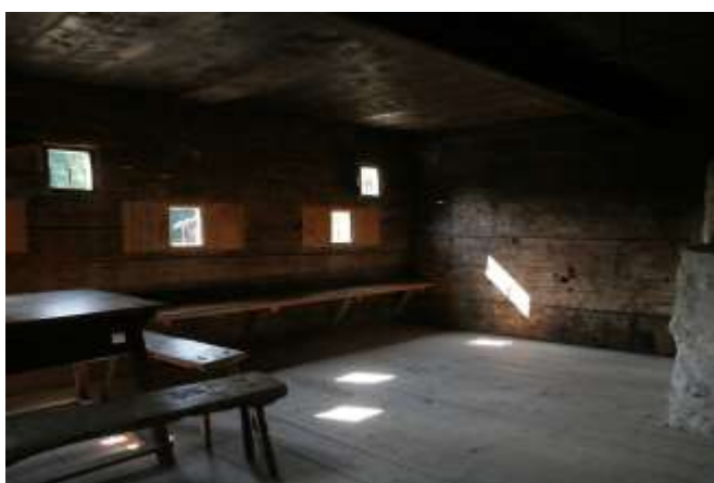
Fig. 15. Este interior de una casa vernácula austriaca expresa el concepto rudofskiano de «lujo del espacio», resultado de la simplificación o de la escasez. Foto de Andrea Bocco Guarneri, Salzburger Freilichtmuseum, Großgmain, 2013.

Para Rudofsky, el fracaso de una arquitectura verdaderamente moderna se medía por el hecho de que una parte importante del espacio de las viviendas estuviera inmovilizado: por ejemplo, había habitaciones reservadas a la función de dormir, permanentemente ocupadas por camas.