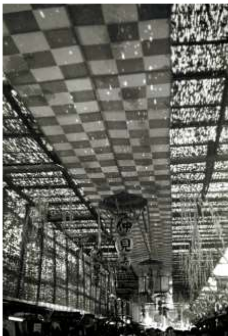
Fig. 17. Bernard Rudofsky, foto de una calle comercial japonesa, 1955.

Entre las muchas observaciones pioneras de Rudofsky, estuvieron las relacionadas con el control del microclima. En sus casas de Brasil, las «habitaciones exteriores» y su vegetación fueron diseñados a fin de crear un microclima agradable. Observó que la tecnología avanzada rechazaba la luz natural, el calor radiante del sol, la brisa para proponer «envolventes» que se apartaban de la naturaleza y consumían mucha energía. En Streets for People , ofreció algunos ejemplos de acondicionamiento ambiental urbano, que incluían protecciones solares (toldos, cañizos, esteras que cubren los espacios públicos) y pasajes cubiertos. [FIG17]