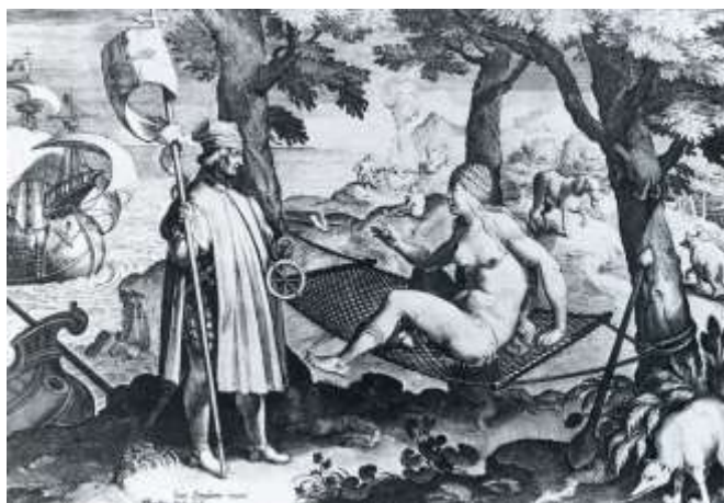
Fig. 2. Grabado de Theodor Galle (desde Stradanus), Amberes, hacia 1586, que representa el encuentro de Américo Vespucio con América. A Bernard Rudofsky le gustaba mucho esta imagen; la usó en el montaje del pabellón de EE.UU. en la Expo de Bruselas y en su libro NIL (p. 100).

En Streets for People , el más político de sus libros, Rudofsky denunció la gravedad de la responsabilidad de los arquitectos en cuanto a la calidad urbana, y para hacerlo se remitió a las palabras de su amiga Ada Louise Huxtable. La amabilidad del entorno construido, su humanidad, el bien común eran, obviamente, menos importantes que el beneficio privado; los arquitectos no eran más que sirvientas de los especuladores que trabajaban para la «muerte de desarrollo» de la ciudad 12 .