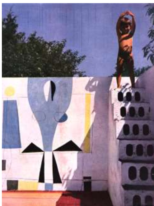
Fig. 14. Autor desconocido (Costantino Nivola?), foto del solarium de la casa-jardín Nivola, obra de Rudofsky y Nivola, Amagansett (NY), alrededor de 1951. Un espacio artificial, al aire libre, quintaesencia de la intimidad (desde el exterior no se puede ver nada del interior), sin perder el contacto sensorial con la naturaleza.

Obviamente, Rudofsky se refería a «la antigua, hecha a mano»: solo los automóviles le causaban tanto disgusto como los sonidos emitidos sin cesar («defecados») por aparatos de reproducción instalados en todas partes, de los que era imposible defenderse («un permanente estado de asedio acústico»), expresamente concebidos para «evitar que la gente piense» 52 y para controlar su comportamiento. En mi opinión — pero es obvio que en esto soy hijo de otra generación, que da por hecho la reproducción de la música — el problema está, sobre todo, en el poder elegir el silencio, cuando se quiera. En la casa de los Rudofsky no había tocadiscos ni radio. Ni, por supuesto, un televisor.