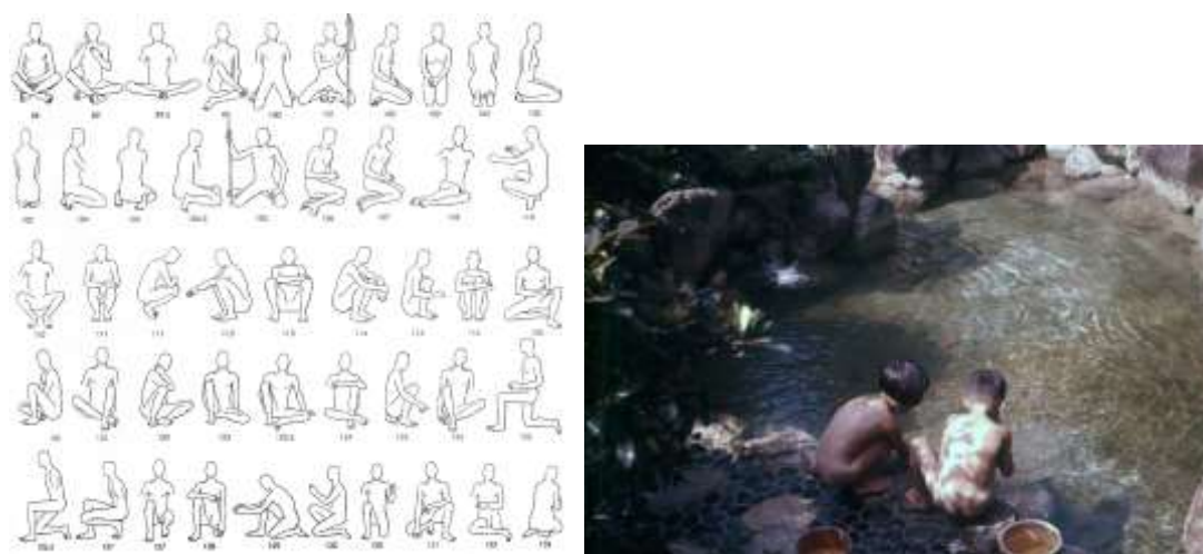
Fig. 3. Dibujo desde Gordon W. Hewes, “Anthropology of Posture”, Scientific American , 196, 1957, reproducido por Rudofsky en NIL (p. 58-59) con la siguiente explicación: “Uncongenial clothing and wrong upbringing deprive industrial man of the many postures available to a less inhibited mankind. A sampling of the most common resting positions shows cross-legged, kneeling, and squatting postures.” Fig. 4. Bernard Rudofsky, niños japoneses en el baño al aire libre, hacia 1958. Un ejemplo de cómo las prácticas cotidianas no necesitan apenas objetos.

estadounidense era el mejor, ya que nadie parecía querer conocer lo de otros pueblos. Una mirada cosmopolita era letal para el conformismo, y se alimentaba con el viaje. Rudofsky opinaba que los estadounidenses eran hostiles a la idea de viajar, por temor incluso a ser contaminados por los conceptos extranjeros. Tanto por su biografía rica en cambios de contexto cultural y de viajes, como por sus obras, Rudofsky proporcionó un ejemplo de cultivo metódico de las capacidades de observación y discernimiento a través de la exposición a diferentes culturas 24 .