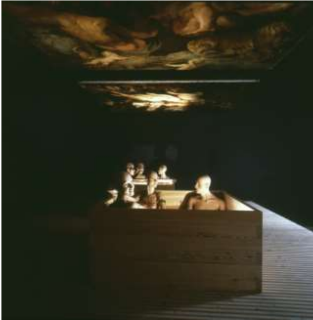
Fig. 16. Gerald Zugmann, foto del «baño convivial» en la exposición de Bernard Rudofsky Sparta/Sybaris , MAK, Viena, 1987.

Otra cuestión sobre la que Rudofsky tenía preferencias exóticas era la de defecar en cuclillas, en lugar de sentado: elección que facilitaba el éxito de la actividad. Prefería, por tanto, la taza turca a la taza habitual; el cuarto donde se colocaba esta podía ser un espacio mínimo pero con gracia, como el japonés tradicional, «un lugar para la contemplación, una guarida para filósofos» 63 .