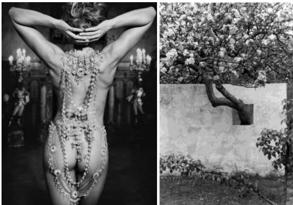
Fig. 10. Mujer vestida de joyas. Marc Lagrange, “Millionaire Woman” (del libro Diamonds & Pearls , teNeues, 2013). Fig. 11. Bernard Rudofsky, foto de manzano que atraviesa un muro free-standing en la casa-jardín Nivola, obra de Rudofsky y Nivola, Amagansett (NY), alrededor de 1950.