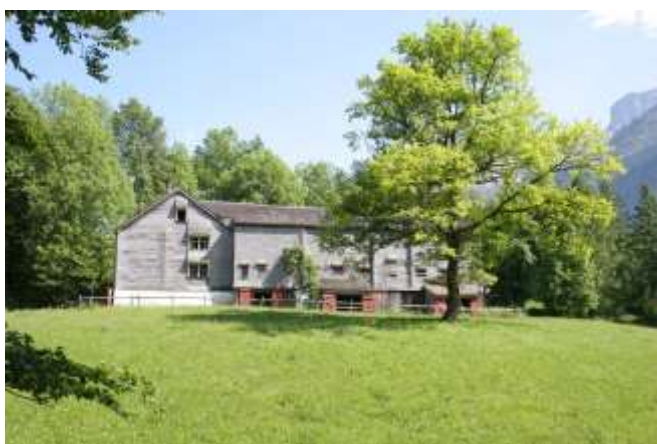
Fig. 5. Algunos ejemplos de arquitectura rural encarnan los conceptos rudofskianos de timelessness , armonía, duración, estabilidad. Foto de Andrea Bocco Guarneri, museo al aire libre del Ballenberg, 2005.

Tanto a propósito del paisaje urbano como del rural, Rudofsky insistió mucho en la diferencia entre las civilizaciones europeas y asiáticas — para las que la tierra era sagrada, igual que los frutos que produce, y la ciudad era un centro de arraigo en el universo — y la mentalidad de los colonos americanos — para los que el continente era territorio enemigo por conquistar y explotar. Este modo de pensar pervive sin duda hoy en día, si bien Gary Snyder ha sabido demostrar que después de algunas generaciones se puede desarrollar un apego auténtico, fundamento existencial de la práctica de la ecología 33 .