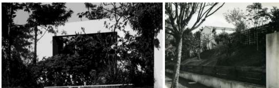
Fig. 12. G.E. Kidder Smith, la casa Frontini, obra de Bernard Rudofsky, vista desde la calle, 1942. La negación absoluta del concepto de «fachada». Tomada con ocasión de la campaña fotográfica para la exposición Brazil Builds . Fig. 13. G.E. Kidder Smith, la casa Arnstein, obra de Bernard Rudofsky, vista desde la calle, 1942. Gracias al ligero desnivel, los espacios y la organización misma de la casa no resultan legibles. Tomada con ocasión de la campaña fotográfica para la exposición Brazil Builds .

Rudofsky aplicó a la casa el mismo esfuerzo de sensualización y humanización de la existencia. En palabras suyas, tendría que ser un «santuario de la fuerza generadora de vida» 50 . Tal propiedad podría conquistarse solo a través de una celosa defensa de la intimidad doméstica, que ya hemos dicho que los Rudofsky practicaban, y que es necesaria para garantizar una vida digna. La convivencia misma, al abrirse al verdadero placer de estar juntos con invitados seleccionados — otro de sus temas favoritos — habría sido «impensable» en una casa privada de íntima afabilidad. Esta visión lo llevó a oponerse a la creencia moderna y puritana de que el edificio debe ser «transparente» desde el exterior: tanto en sentido literal (la mirada indiscreta debe bloquearse) como metafórico (no había necesidad alguna de hacer legible la organización interna de casa). [FIG12,13]