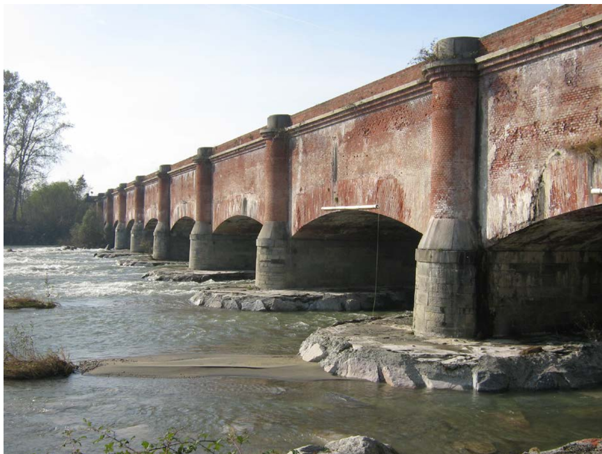
Figura 2. Il ponte-canale presso il fiume Dora Baltea.

Invece, nel caso del sottopassaggio dei corsi d'acqua, l'infrastruttura idraulica scompare attraverso l'architettura ipogea della tomba sifone e restituisce in superficie una grande piazza lastricata. Lungo i suoi ottantadue chilometri di sviluppo l'infrastruttura rilegge le forme della Terra assumendo i terrazzi come basamento, le vallate come spazio in negativo da completare, e il suo stesso invaso come "summa cavea" di un immenso teatro geografico ai piedi del fiume Po. In questa direzione, il manufatto assume un ruolo importante nella narrazione del territorio e delle sue specificità diventando esso stesso una lezione di geografia a cielo aperto. Questa "messa in scena" della forma del territorio utilizzando il carattere di dispositivo di rappresentazione insito nell'architettura ci riporta alle pratiche della disciplina geografica ottocentesca, dove l'aspetto pedagogico dell'insegnamento privilegia la pratica nella trasmissione del sapere (Besse, 2003). Questo atteggiamento assegna al costruito il compito di illustrare gli aspetti che riguardano la geografia attraverso l'allestimento in un giardino di una carta geografica fino ad arrivare alla costruzione di veri e propri edifici atti ad illustrare la Terra ("géoramas"). Rispetto a questo tema, risulta particolarmente interessante come questi luoghi, strumento di divulgazione della disciplina geografica, assumono anche la connotazione di "loisir" diventando veri e propri spazi pubblici all'interno della città.