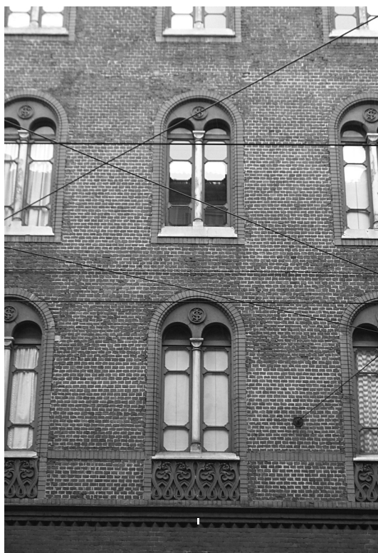
FIG. 2. Complesso salesiano di San Giovanni Evangelista, Torino: particolare di facciata su via Madama Cristina. Gli ornati in cotto richiamano gli studi ornamentali di Owen Jones, usciti a Londra una quindicina d'anni prima.