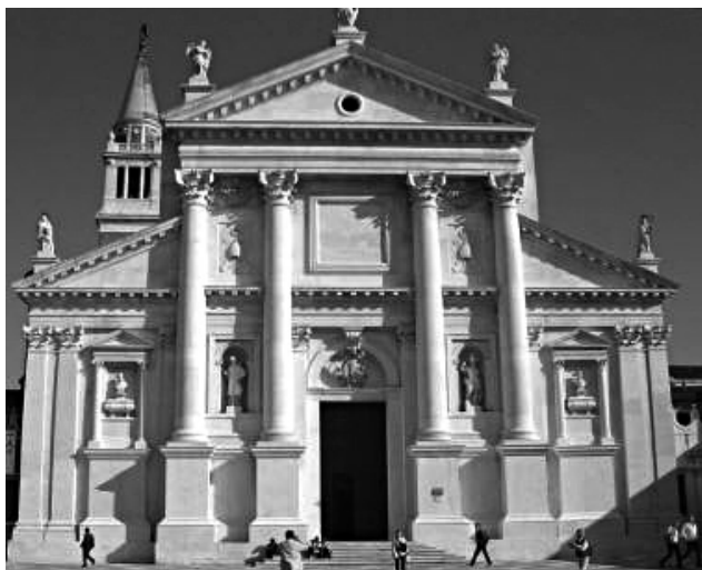
FIG. 5. Andrea Palladio, facciata della chiesa di San Giorgio Maggiore a Venezia.