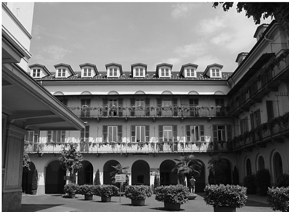
FIG. 1. Complesso salesiano di Valdocco, Torino: prima corte dietro la basilica.