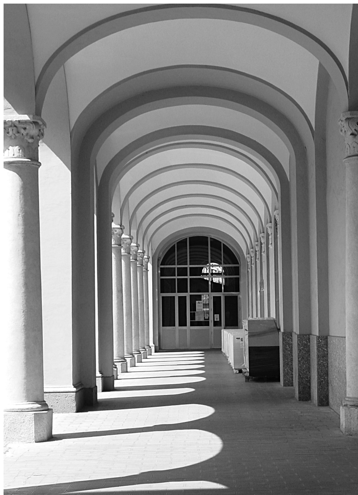
FIG. 6. L'arioso porticato delle scuole nel complesso salesiano di Valdocco, Torino (foto E.M.).