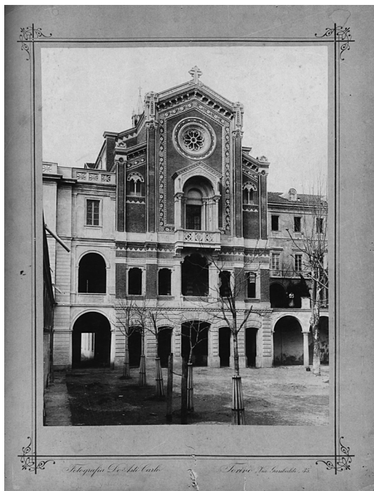
FIG. 8. Carlo De Asti, veduta della chiesa di Valsalice a Torino. Il primo piano evidenzia l'adozione di tutori per le piante, suggestivo richiamo al contesto dell' ortopedia morale cara alla didattica di Don Bosco (da G. Bracco, Torino e don Bosco , Torino, Archivio Storico della Città 1989).