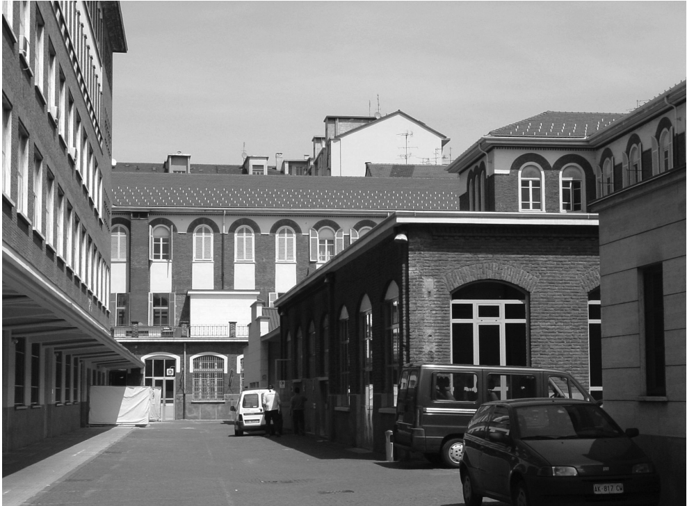
FIG. 3. Eclettismo salesiano tra Otto e Novecento. Complesso salesiano di Valdocco, Torino.