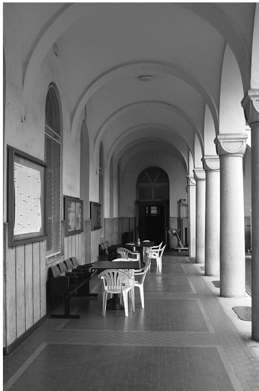
FIG. 7. Porticato neomedievalista nella corte del complesso salesiano di San Giovanni Evangelista, Torino.