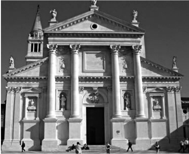
FIG. 5. Andrea Palladio, facciata della chiesa di San Giorgio Maggiore a Venezia.