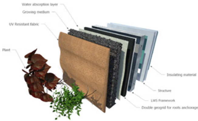
03 | Schema del sistema parete GRE_EN_S, disegno del gruppo di ricerca DAD Isometric of GRE_EN_S assembly; sketch by DAD

– strato di protezione: realizzato attraverso l’abbinamento di un feltro in PE e viscosa, in grado di ridurre lo spessore e il peso della parete verde.