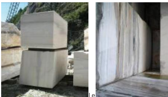
Fig. 3 - A sinistra, i blocchi ricavati dal taglio con filo, pronti sul piazzale. A destra, nella nicchia ricavata con tagliatrice a nastro, sono visibili venature grigio-rosa.

Il marmo di Candoglia è un materiale lapideo anisotropo, di colorazione variabile dal bianco al rosa al grigio, sia con tonalità omogenee sia con tonalità sfumate e con striature o venature. Le caratteristiche geomeccaniche sono state determinate con prove di laboratorio volte ad individuare la distribuzione di tali parametri ed il comportamento in condizioni elastiche e in prossimità della rottura. L'anisotropia è evidente sia nei blocchi sia in bancata (Fig.3).