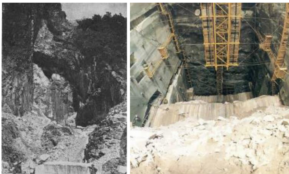
Fig. 1 - A destra la Cava Madre come si presentava agli inizi del 1900. Sulla destra, la volta e il fronte della parte più interna della cava, ad inizio anni '90. La coltivazione di tale settore è attualmente ferma in considerazione della fratturazione del marmo e delle convergenze misurate: in tale contesto la resa in blocchi e lastre può scendere sotto il 20%.

Dal punto di vista ingegneristico e tecnico gli aspetti di interesse e studio sono molteplici. Dal punto di vista statico la caverna è caratterizzata da grandi sfondi e da luci libere (Fig. 1), createsi con la completa coltivazione del marmo costituente il banco sub verticale, talora sede di vuoti dovuti a processi di dissoluzione dei carbonati, e comunque caratterizzato da discontinuità parallele al banco e oblique ad esso. Le pareti incassanti, di roccia scistosa e quarzifica, presentano notevoli contrasti di rigidità con il marmo. Oltre agli aspetti di complessiva stabilità delle pareti va ovviamente riguardata la stabilità locale anche nel riguardo di potenziali distacchi di scaglie che potrebbero costituire un rischio per gli addetti.