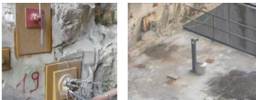
Fig. 5 - A sinistra il dettaglio di una mira topografica affiancata ad un tirante a trefoli strumentato con cella di carico anulare. A destra l'unità di oscillazione del pendolo diretto, il cui punto di sospensione è collocato sulla volta al di sopra del secondo travone trasversale.