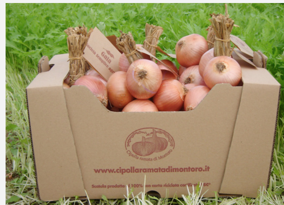
Presidio Slow Food Italia della cipolla di Montoro della Società Semplice Agricola Gaia

"Strumenti per diffondere nuove logiche di consumo"