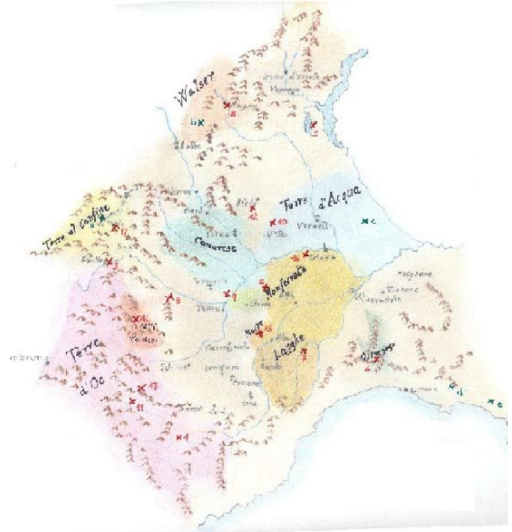
In questa pagina, a sinistra: estratto della carta dell'autostrada A6 Torino Savona; a destra: "aree di carattere" nel Quaderno n.18 della pianificazione, I caratteri del territorio piemontese, Regione Piemonte, 2004

alla strutturazione del territorio, pur non appartenendo ad un tema specifico. Rientrano in questo caso per esempio i percorsi naturalistici, quelli culturali, quelli architettonici, dimenticando, però, che non esistono realtà così omogenee da considerare esaustivo questo genere di lettura: in un itinerario del verde ci si dimentica sempre che alla fine bisogna passare in un quartiere artigianale.