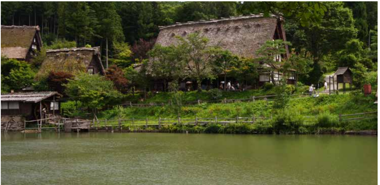
Edifici del villaggio