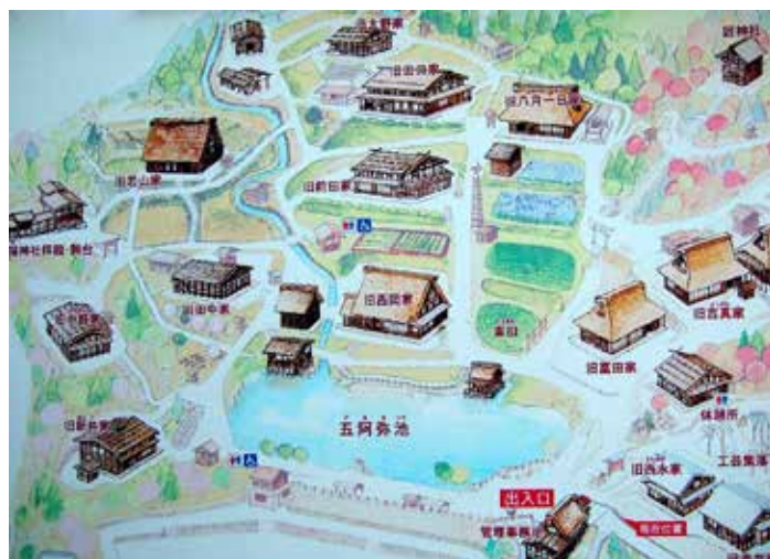
Mappa del villaggio

rapidamente fuggendo e che, proprio per questa ragione, va didatticamente documentata e raccontata, anche a costo di una sua ricostruzione in vitro. Ma c'è anche il senso di un'architettura di lungo periodo, a cui si guarda oggi non per recuperare banalmente forme e stili, ma come palinsesto di saperi e di tecniche da conoscere e imparare, ancor prima che da reinterpretare: detto altrimenti, un'idea della storia come materiale operabile.