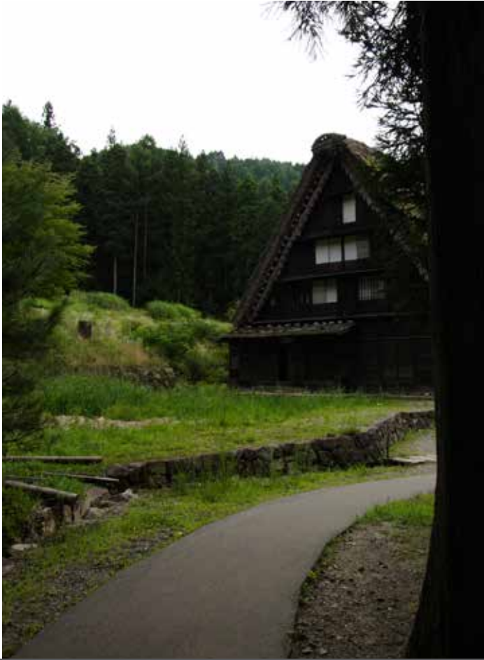
Edificio del villaggio