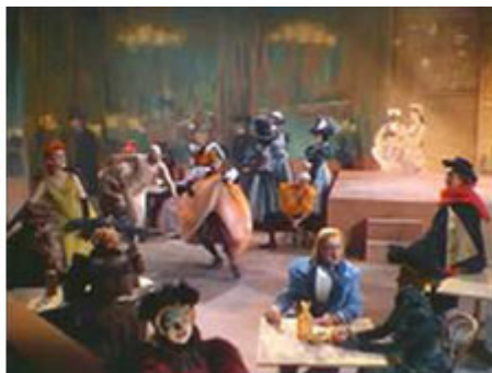
Fig. 9 - Toulouse-Lautrec, Au Moulin rouge , 1890 e citazione nel film "Un americano a Parigi"