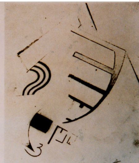
Fig. 10 - Viking Eggeling, Diagonal Symphony , 1924, schizzo a matita per l'animazione.