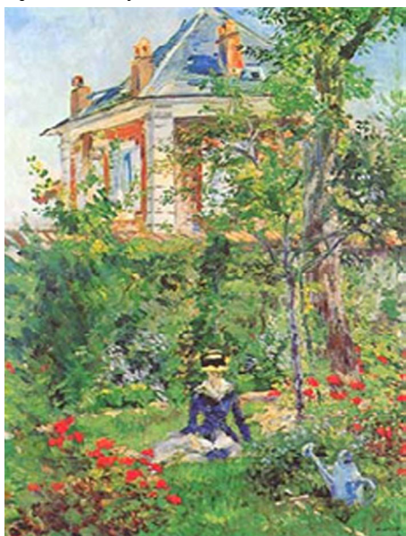
Fig. 7 - Edouard Manet, Ragazza in giardino a Bellevue , 1880 e citazione nel film "Un americano a Parigi"