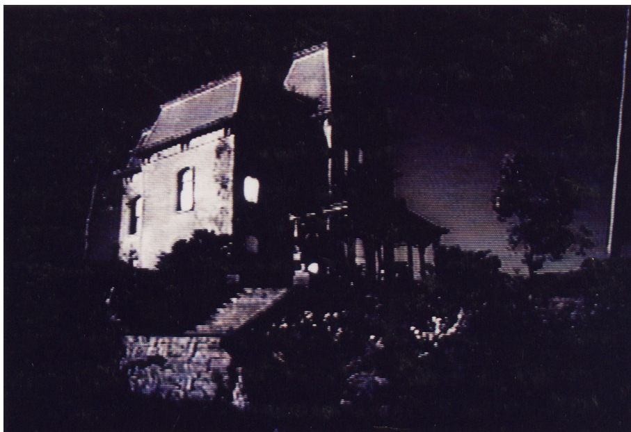
Fig. 2 - Una puntuale citazione hitchcockiana della pittura realista di Edward Hopper per il film Psycho