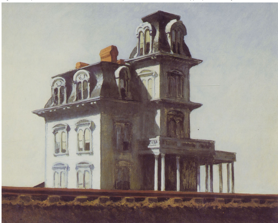
Fig. 3 - Edward Hopper, La casa sulla ferrovia , 1925, citata da Hitchcock nel film Psycho .