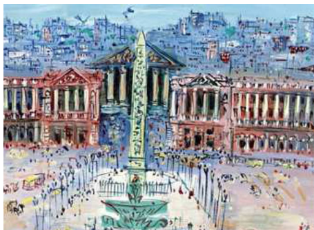
Fig. 6 - Raoul Dufy, Place de la Concorde , 1936 e citazione nel film "Un americano a Parigi"