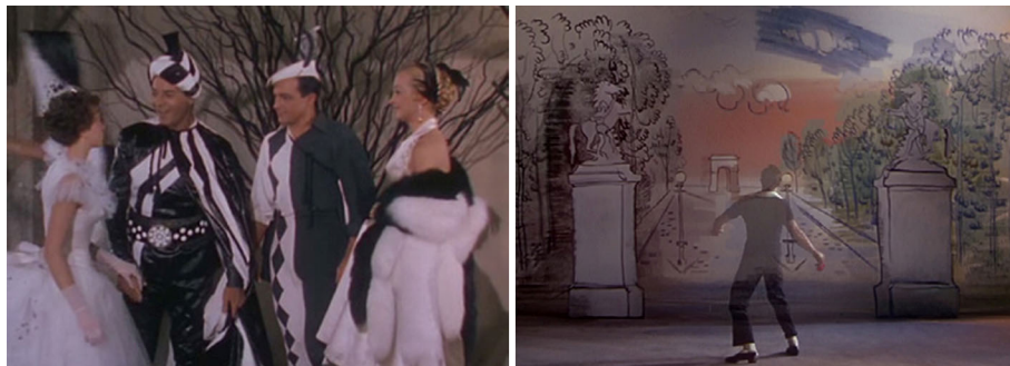
Fig. 1 – Nella prima scena, originale e suggestiva, tutti i personaggi sono vestiti di bianco e nero e si perde del tutto la percezione dei diversi ruoli. A questa omogeneità cromatica si oppone un fenomeno di mascheratura che tende a ripristinare i ruoli dei diversi personaggi: ognuno è vestito in bianco e nero, ma il tipo di travestimento richiama fortemente il suo ruolo nella vicenda. Nella seconda scena Gene Kelly appare in trasparenza vestito di nero; sullo sfondo uno schizzo a carboncino di una veduta di Parigi, colorato con grandi pennellate ad acquerello.

Questo breve excursus è teso a confermare lo stretto incrocio (all'interno di tutte le arti visive) fra cinema e pittura, in tutte le sue forme. Gli esempi sono infiniti: oltre a quelli già citati, possono seguirne altri: nel campo del colore come citazione colta, lo scenografo Dante Ferretti colloca alcune scene dell' Età dell'innocenza (di Scorsese) in ambienti tinteggiati con la nuance Patent yellow (o giallo Turner), cromatismo derivato da Joseph Mallord Turner, a sua volta tributario delle teorie di Goethe, situando (anacronisticamente, in un racconto ambientato nella New York del 1870) il dipinto l'Arte, le carezze e la Sfinge , che Khoppf dipingerà solo nel 1896. Il colore risulta decisamente caratterizzante anche nei titoli di testa o di coda di Saul Bass (come per esempio nell' Uomo dal braccio d'oro , di Otto Preminger, o in Casino , di Martin Scorsese). Possiamo dunque concludere che nell'attuale civiltà dell'immagine si potrà meglio definire una vera "civiltà del cinema" (in un reale incrocio interdisciplinare), anche attraverso l'irrinunciabile contributo della cultura della visione, in particolare del colore.