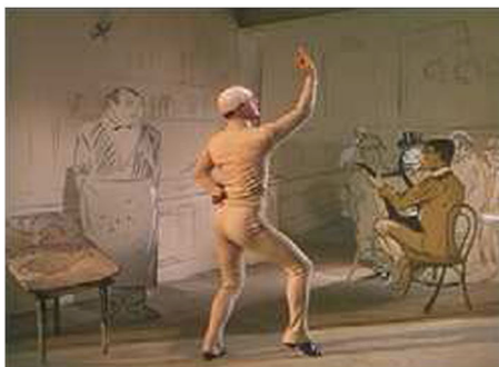
Fig. 8 - Toulouse-Lautrec, Chocolat Dancing in Bar Darchille , 1896 e citazione nel film "Un americano a Parigi"