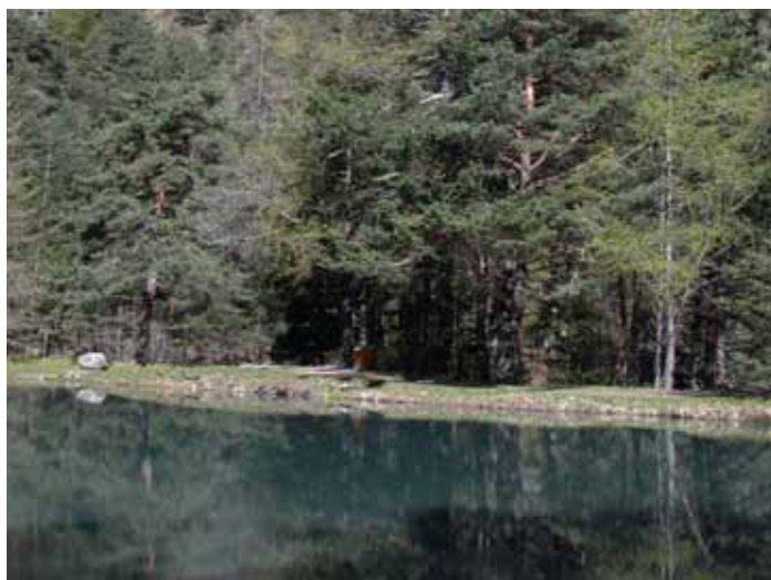
Lago della Ghiacciaia, Salbertrand