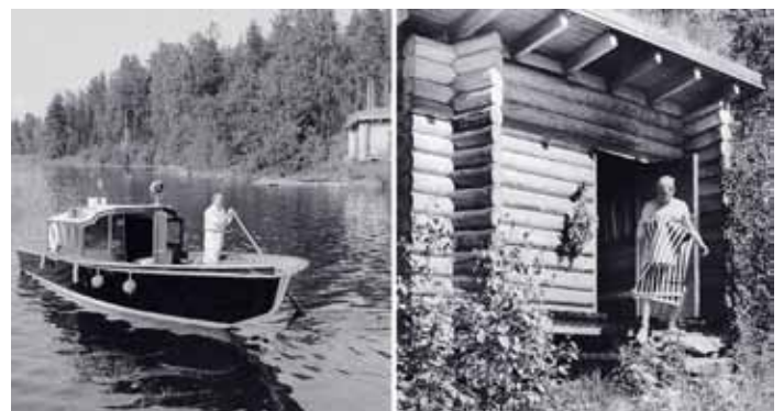
Aalto, la sauna e il lago Päijänne negli anni cinquanta.