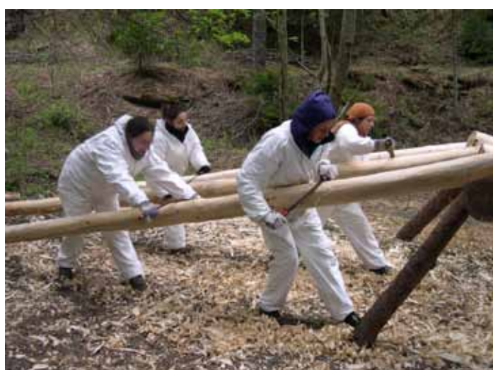
Fase di scortecciamento con attrezzatura specifica finnica (foto T. Marzi).