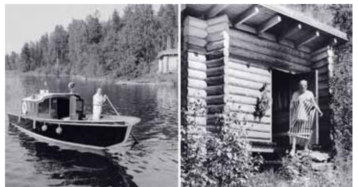
Aalto, la sauna e il lago Päijänne negli anni cinquanta.