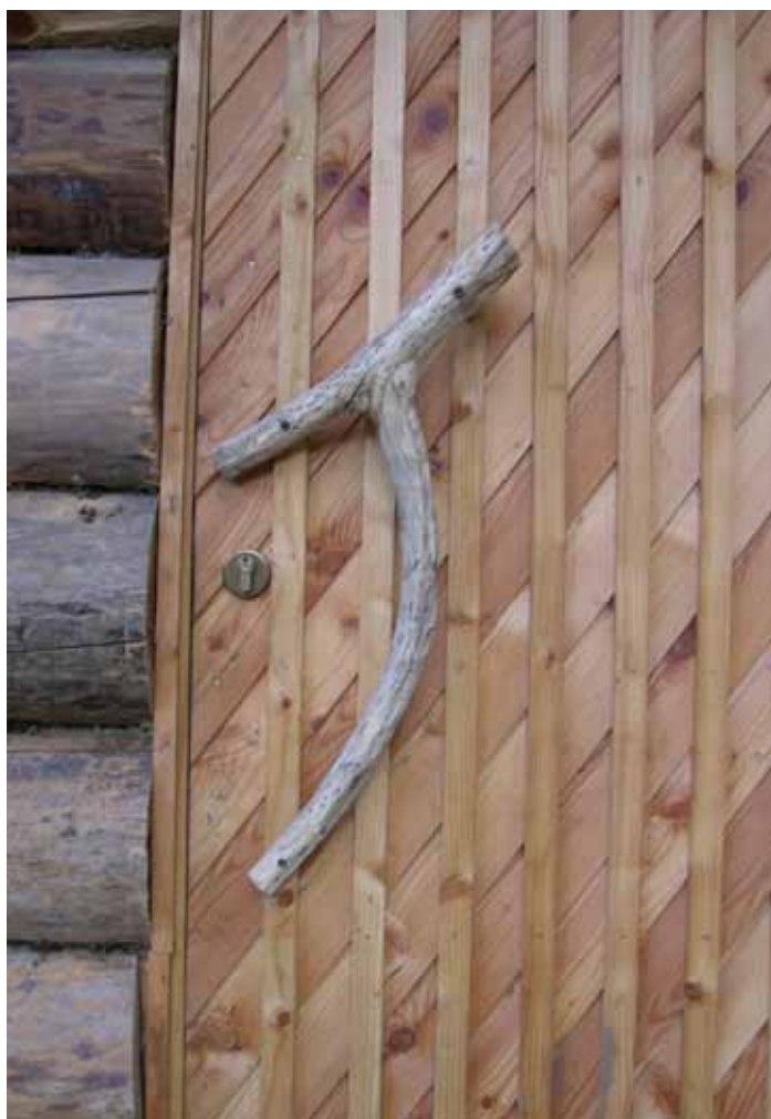
Dettaglio della porta d'ingresso alla sauna.

Culture 2000: http://www.culture2000-wood.org/