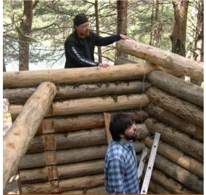
Fase di realizzazione del blockbau.