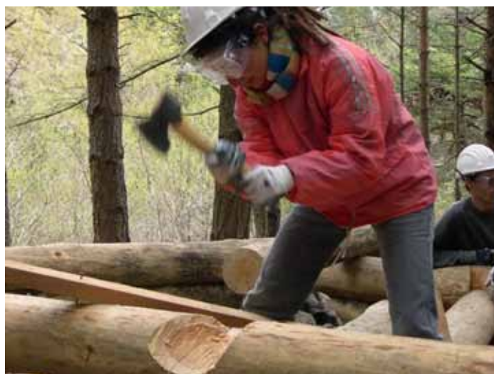
Fase di realizzazione degli incastri lignei.