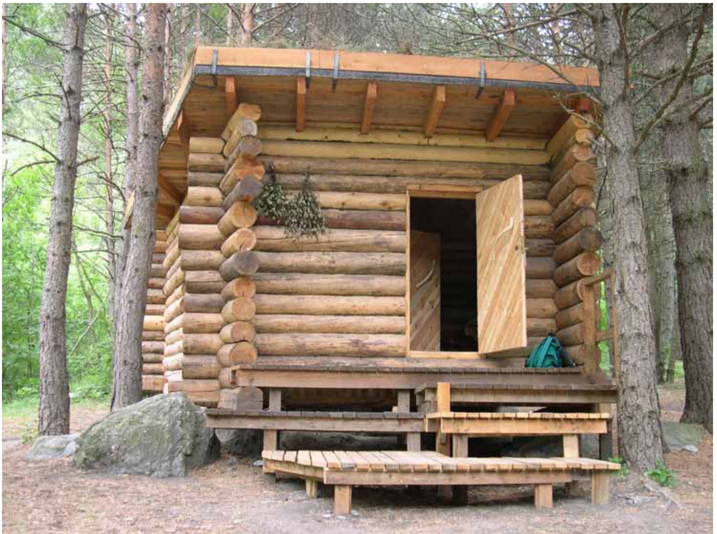
La sauna di Salbertrand completata.