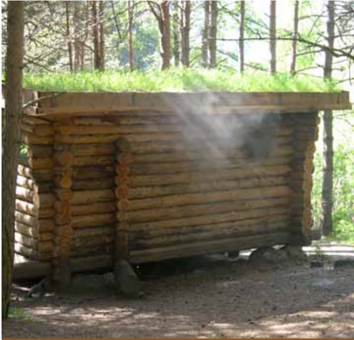
Tetto verde e prova di funzionamento della smoke-sauna.