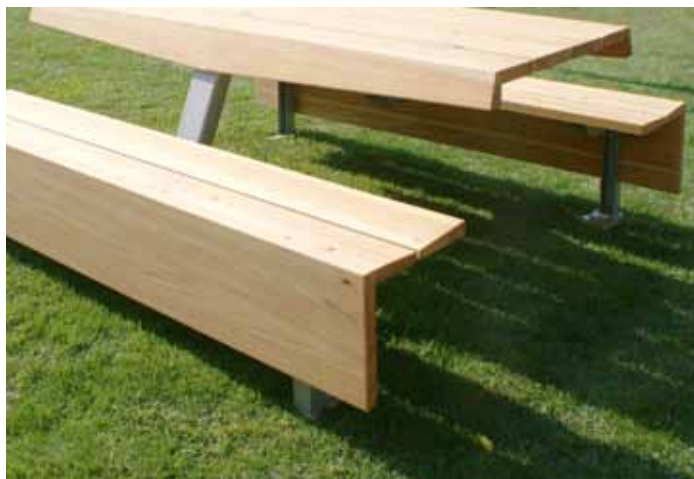
Tronca: seduta modulare organizzabile con schienali prendisole ribaltabili e schienali fissi o strumenti ginnici.

Il legno, risorsa diffusa nei territori montani piemontesi, in Valle Varaita già da alcuni anni è stato oggetto di progetti di valorizzazione nell'ottica di rilancio del savoir-faire artigianale e del sistema produttivo locale in un'ottica di filiera e di progetto condiviso. Dopo le esperienze sul "re-design del mobile alpino", condotte dall'unità di Ricerca di Design del Politecnico di Torino (2000/2001), e quelle del Centro per la Lavorazione Artigianale del Legno di Isasca (2006), creato a supporto delle attività produttive del distretto regionale di Verzuolo (carta e artigianato ligneo), oggi la ricerca/azione esplora, come nuovo ambito, la produzione di "arredi per esterni".