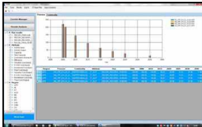
Tabular representation of the results and their evolution over the time horizon covered by the modeling.

La digitalizzazione dei corridoi è stata effettuata utilizzando svariate e diverse tipologie di fonti di informazione: letteratura tecnica e mappe che mostrano oleodotti e gasdotti, Atlanti dell'energia a scala nazionale o internazionale, set di dati geografici disponibili sulle infrastrutture energetiche, testi, tabelle e mappe prodotte dai diversi enti nazionali e dalle organizzazioni internazionali, immagini satellitari, documenti e immagini sulla densità del traffico marittimo.