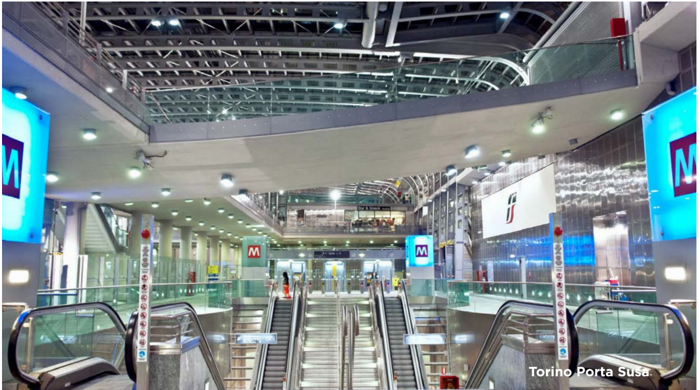
Torino Porta Susa

internazionale e nazionale, sia con riferimento all'efficacia del funzionamento di Torino e del territorio metropolitano ed esterno come sistemi locali.