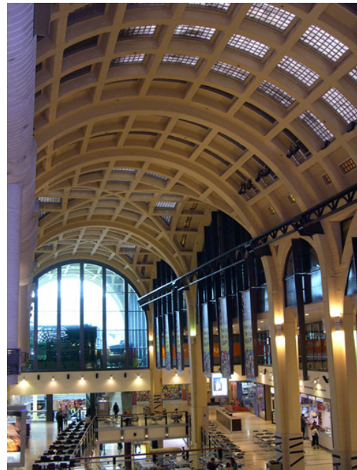
Figure 5-6. Buenos Aires, Mercado de Abasto Proveedor, 1929-34. Interno dopo l'intervento di rifunzionalizzazione.