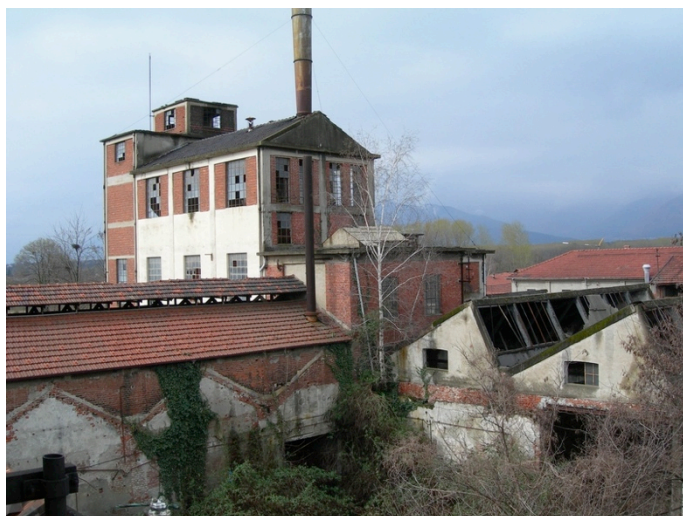
Figura 3. Ciriè (Torino), IpCA. Veduta con in primo piano la corte più antica e sullo sfondo la cosiddetta "torre".

di Crespi d'Adda fu iscritto nella lista del patrimonio mondiale 4 (BELTRAN DEL CORRAL, 2003).