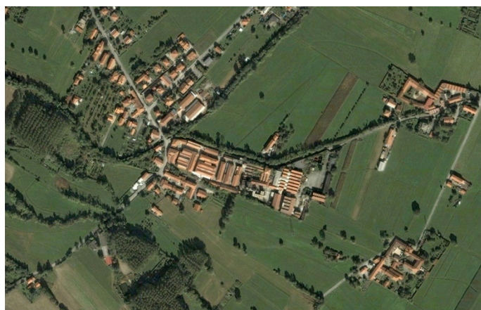
Figura 1. Ciriè (Torino), IpCA. Foto aerea del territorio: al centro il complesso industriale e gli insediamenti agricoli limitrofi.

In effetti lo studio degli antichi edifici industriali necessita un processo di conoscenza molto complesso che partendo dalle origini del monumento ne consideri tutte le tappe della storia comprese le più recenti, quelle cioè che hanno creato oggi quell'interesse meramente utilitaristico tale per cui è stato necessario, purtroppo, modificare radicalmente sia la logica costruttiva sia formale dei complessi industriali.