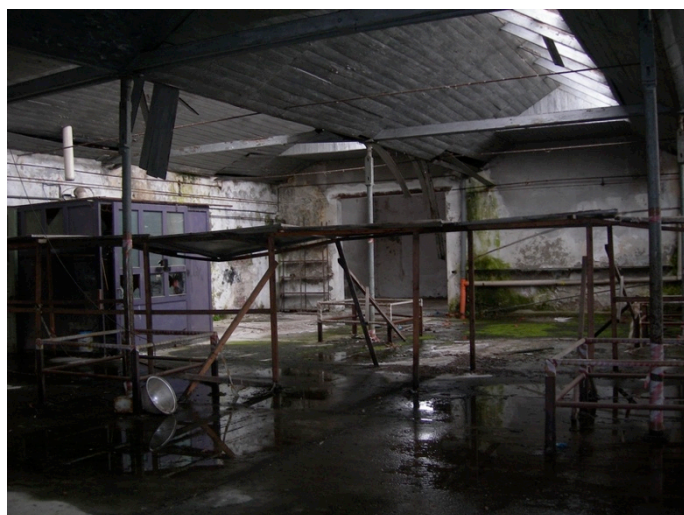
Figura 4. Ciriè (Torino), IpCA. L'interno della corte più antica con le colonne in ghisa che reggono la copertura.

aree industriali dimesse utilizzando spazi aperti e architetture come luoghi per manifestazioni culturali, musicali, particolari eventi, oppure come sedi museali, o come spazi per l'istruzione, la formazione, i servizi sociali.