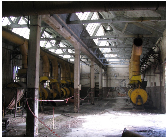
Figura 6. Ciriè (Torino), IpCA. L'interno del padiglione per la lavorazione dei coloranti che, dopo il restauro, verrà adibito a museo della memoria.

Un'attenta conservazione meritano i padiglioni 9 e 12, in origine un unico corpo di fabbrica diviso da un androne che dall'atrio permetteva il passaggio nell'area all'aperto della primitiva fabbrica. Tale edificio ha conservato i suoi caratteri formali, strutturali, distributivi. Esso presenta interessanti sistemi di copertura ancora con capriate lignee e manto di tegole; un prospetto la cui tessitura muraria è interrotta da una serie di aperture ancora originali o solo in parte sostituite. Tali spazi offrono interessanti spunti per una loro possibile rifunzionalizzazione, ciò favorito anche da un ottimo stato di conservazione garantito, sembrerebbe, da operazioni di manutenzione ordinaria piuttosto recenti.