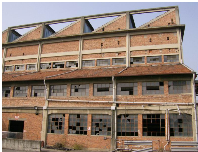
Figura 5. Ciriè (Torino), IpCA. Veduta esterna di uno dei padiglioni destinati alla vendita di prodotti agro-alimentari.

Si sono, quindi evidenziate potenzialità e criticità che hanno guidato la scelta di abbattere alcuni edifici, di restaurarne altri attraverso un compatibile cambiamento di destinazione d'uso, di conservare rigorosamente alcuni padiglioni in cui la "memoria della fabbrica" è più percepibile ed è garantita dalla presenza di antichi macchinari e sistemi energetici ancora in situ .