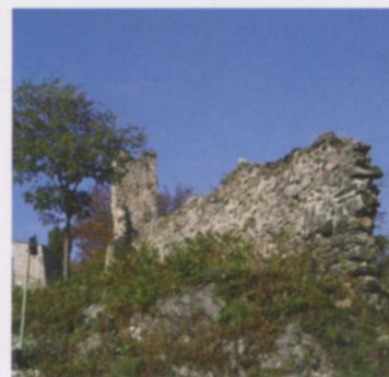
▲ Ruederi della cinta sulla sommità della collina