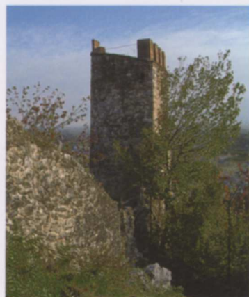
◀ ▼ Resti delle torri quadrate nel muro di cinta