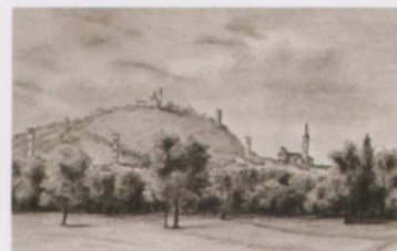
▲ C. Rovere, Caraglio , 1845