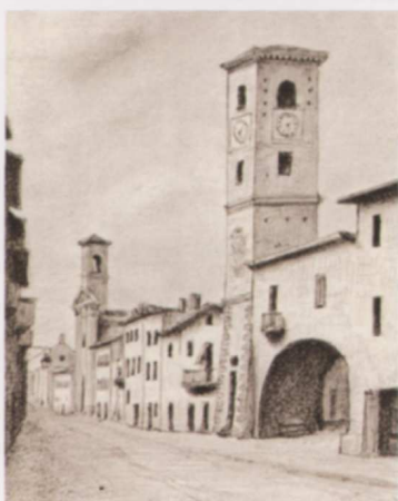
▲ C. Rovere, Torre e contrada principale di Borgo San Dalmazzo, 1845