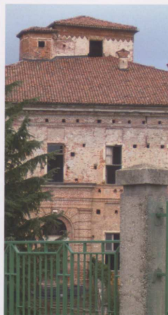
▲ Fronte principale del palazzo con la torretta emergente

Il complesso è oggi abbandonato e versa in pessimo stato di conservazione. Si rendono necessarie, previa la messa in sicurezza del sito, indagini stratigrafiche e archeologiche atte a identificare le preesistenze medievali, prima di procedere con il completo restauro della fabbrica.