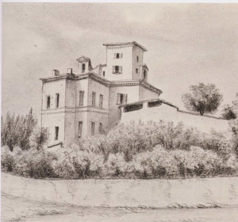
◀ C. Rovere, Castello di Beinette , 1843