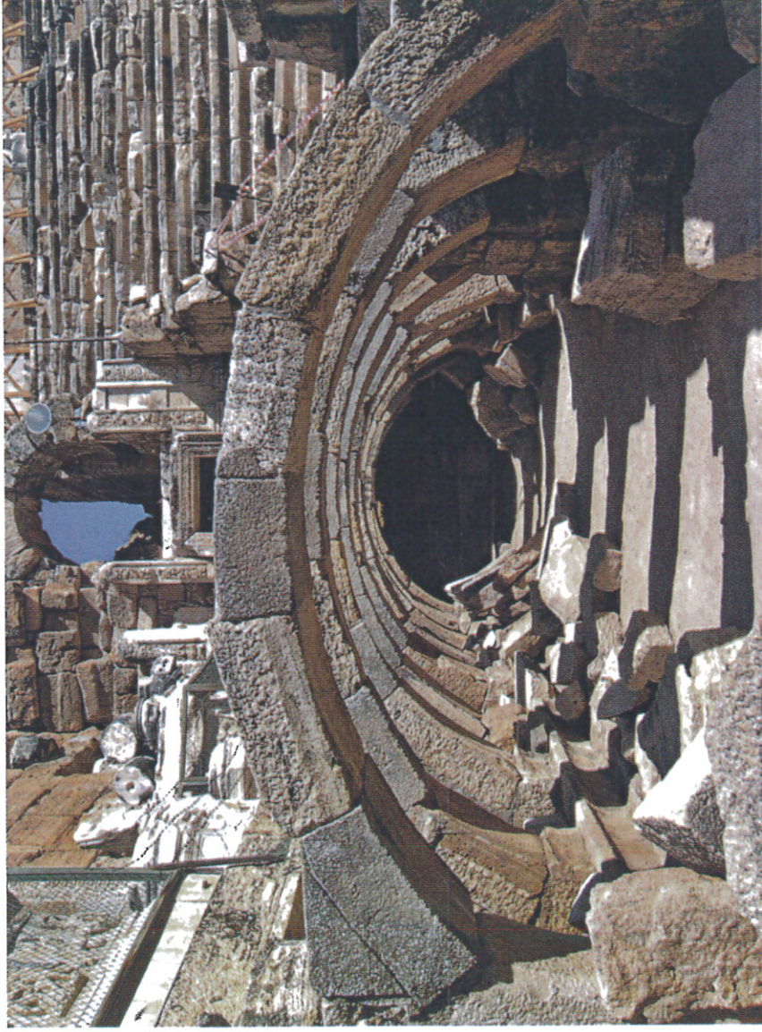
teatro di Hierapolis vista degli archi