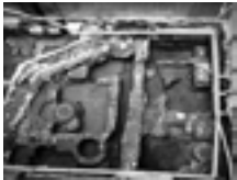
Fig. 1a. Torino, veduta degli scavi all'interno del cortile dell'Archivio Storico della Città di Torino, in via Barbaroux 32, nel 1996, al termine delle indagini.

progetto della luce e tecniche di illuminazione; tecniche di commento.