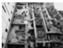
Fig. 4a. Torino, piazza San Giovanni. L'area archeologica della basilica del Salvatore al termine degli scavi nel marzo 2000.