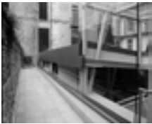
Fig. 3b. Torino, Palazzo San Liborio, vista della copertura all'interno del cortile.

importanza, costituito dal sito dell'antica basilica paleocristiana dedicata al Salvatore.