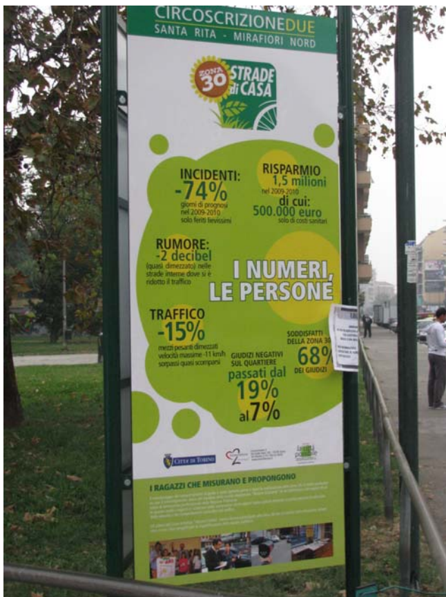
Un pannello illustra i risultati raggiunti nei primi due anni di vita della Zona 30 di Mirafiori Nord.

sicurezza nella zona, sulla percezione dei risultati ottenuti ecc.), di animazione (con eventi locali per favorire l'adesione al progetto), di empowerment (ad esempio con l'affidamento a soggetti locali della manutenzione dei nuovi elementi verdi o dei nuovi giochi inseriti).