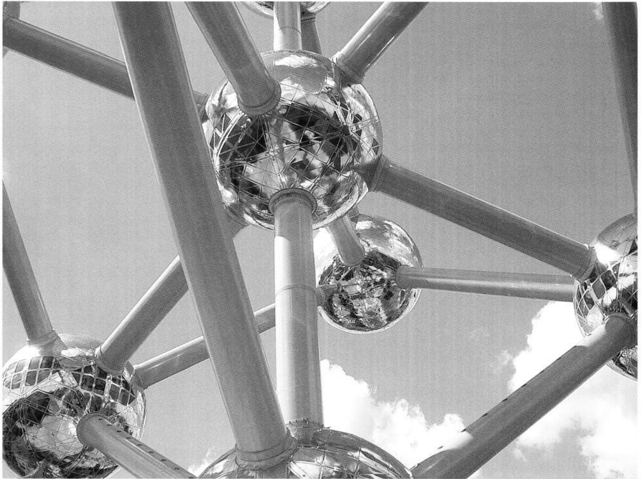
L' Atomium (vista parziale) realizzato a Bruxelles-Heysel per l'Esposizione Internazionale del 1958 (André Waterkeyn, André e Jean Polak). L'edificio è stato riaperto al pubblico il 18 febbraio 2006 dopo più di un anno di restauri.