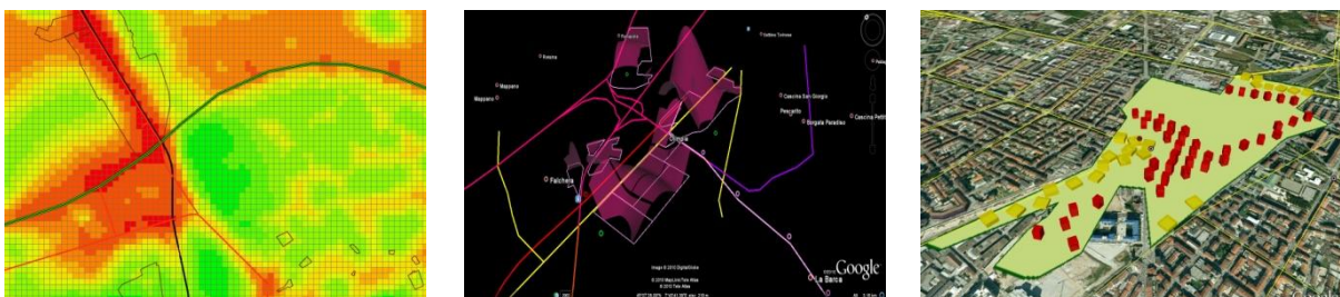
Figura 2 – Esempi di visualizzazioni: bidimensionale a base cromatica, tridimensionale simbolica e tridimensionale quantitativa