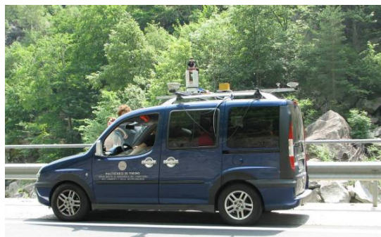
Figura 2 – Veicolo in fase di rilievo

Il rilievo è stato svolto, sostando su ognuno dei 24 punti pre-segnalizzati, per circa 15 minuti, tempo sufficiente per effettuare una scansione laser a 360° di orizzonte e lo scatto di tutte le fotografie. Inoltre tale tempo, consentiva anche una corretta durata per effettuare un posizionamento statico tra veicolo e master, vista la ridotta distanza della baseline. Nella figura che segue, un particolare del veicolo durante la fase di rilevamento.