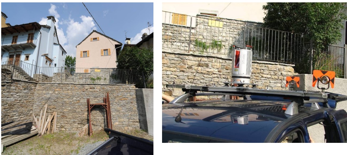
Figura 2 – Poligono di calibrazione e

Secondariamente è stato definito un poligono realizzato con dei “marker” riflettenti attaccati ad un muro ed alcuni prismi collocati su basetta posti su treppiede e a terra (figura tt). Tutti i punti sono stati rilevati sia con il laser scanner che con la stazione totale. Successivamente la posizione del laser scanner è stata rilevata con la stazione totale così come tutte le posizioni dei sensori, e a tale scopo è stato collocato un prisma al posto di ogni sensore (figura xx),. In questo modo è stato possibile determinare le relazioni di trasformazione per il passaggio tra i singoli sistemi di riferimento locali a quello assoluto.