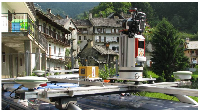
Figura 2 – piattaforma del sistema mobile