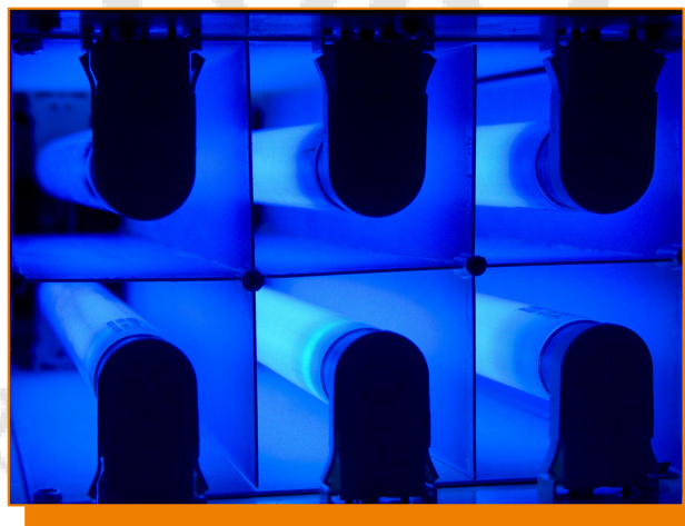
Fotografia di un prototipo e suo particolare