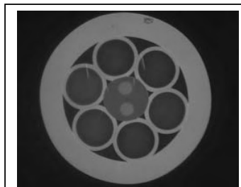
Figura 2: sezione di un PC composto da 6 fibre di pompa e una di "feedthrough" a mantenimento di polarizzazione