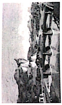
C. N. Ledoux, de la cité de Chaux , 1785. Libri de janne . Evolution de l'architecture . Vue panoramique du point de la Loue .