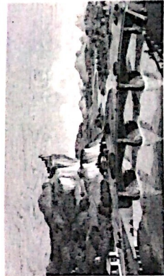
C. N. Ledoux, de la cité de Chaux , 1785. Libri de janne . Evolution de l'architecture . Vue panoramique du point de la Loue .