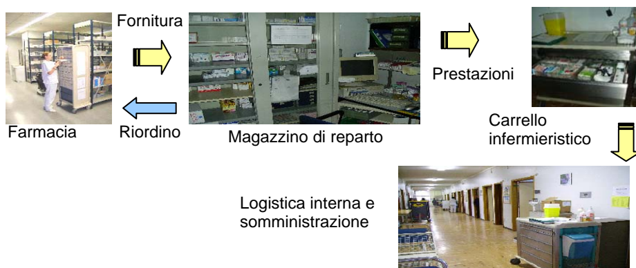
Figura 1: Flusso tradizionale dei farmaci

In figura 1 è schematizzato il flusso di farmaci che più di frequente si incontra in un ospedale.