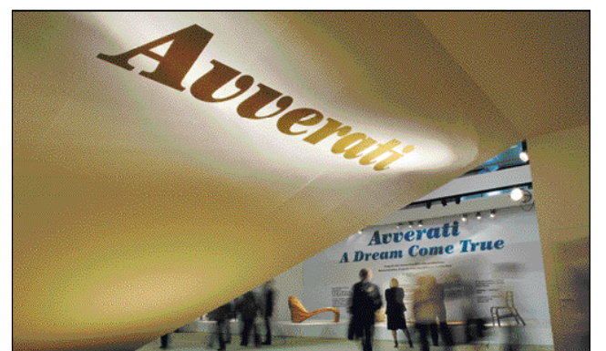
L'ingresso del Salone Satellite

MILANO. Essere giovani o, meglio, lavorare con i giovani designer, sembra essere diventata negli ultimi tempi un'opportunità di marketing e una strategia di comunicazione per le aziende: scelgo un designer giovane perché porta con sé visibilità e attenzione da parte dei media. Del «fenomeno giovani», questo è certamente un aspetto negativo, al quale bisogna porre massima attenzione per evitare il rischio di farlo degenerare in iniziative sterili e prive di contenuto. Se ci concentriamo tuttavia sui lati positivi, significativo è il fatto che recentemente mostre, concorsi e dibattiti abbiano dato il giusto spazio, perlomeno in Italia, a una generazione dinamica e capace, che ha saputo far parlare di sé proponendosi a collaborazioni importanti, portando il progetto in mondi ancora in-