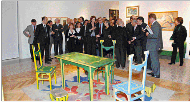
Inaugurazione della mostra «Camera con vista», evento collaterale a Palazzo Reale. A fianco, Euroluce, Salone Internazionale dell'Illuminazione

SEGUE DA PAG. 39 renti (luce+colore) e i merletti traforati (luce+materia). Restano alla fine alcune certezze: appannata la scuola inglese, non più in testa a tirare la volata; stabili olandesi e francesi, con Jean Nouvel sempre più padrone della scala 1:1; in forte ascesa i giapponesi. Accanto alle zampate dei vecchi maestri, visibile un ricambio generazionale che ha per protagonisti molti giovani italiani. Non so se il design si rinnoverà identificandosi con il bio , l' eco o l' equo , ma forse si sta facendo stra-