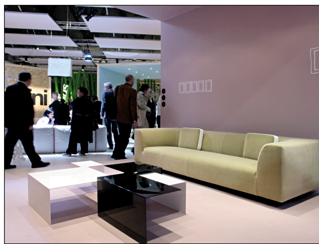
Stand Cappellini al Salone del Mobile di Milano. A fianco, vista del Quartiere Fiera Milano a Rho durante le giornate del Salone

te invidiabile, sempre capace di dettare il tempo della nostra estetica quotidiana. Certo, occorre intendersi sulle parole: design non è più sinonimo d'intelligente misura dell'utile. Nella stragrande maggioranza dei casi e soprattutto nella percezione comune, ormai prevalgono le valenze simboliche ben più di quelle funzionali. Per valutare la distanza che ci separa dall'eroico design del passato basta visitare l'interessante mostra «Camera con vista», allestita nelle sale di Palazzo Reale. Ecco allora imporsi una prima chiara evidenza: a trionfare in questi giorni è una debordante tecnologia, spettacolare e spettacolarizzata. Prevedibile nel mondo dell'illuminazione, dove la tecnica ha trasformato la luce in un materiale con cui costruire lo spazio, virtuosistico esercizio in bilico fra il-