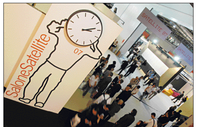
Due immagini dell'evento collaterale «Avverati: A Dream Come True»