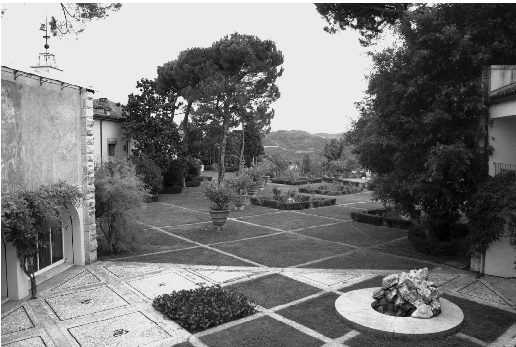
Fig. 4 Il giardino delle rose, Villa Ottolenghi Wedekind, Monterosso, Acqui Terme. Foto di Marco Ferrari 2020. - Resta ancora oggi ben percepibile il dialogo scenografico tra dimora, giardino e contesto, ragionato da Pietro Porcinai nel 1956 attraverso la progressione scalare delle geometrie e l'uso della componente vegetale sempreverde, dall'architettura del patio di Vaccaro che inquadra il paesaggio dell'acquese come un boccioccena.

le radure. In questo modo si verrebbe a costituire un museo outdoor , in grado da un lato di mettere in risalto il dialogo tra arte e natura, dall'altro di rivelare progressivamente la valenza artistica di Monterosso, favorendo il raggiungimento dell'acropoli. Tra le architetture e il giardino in vetta si trovano gli spazi per incentivare la creatività di un nuovo crocevia di artisti, organizzando esposi-