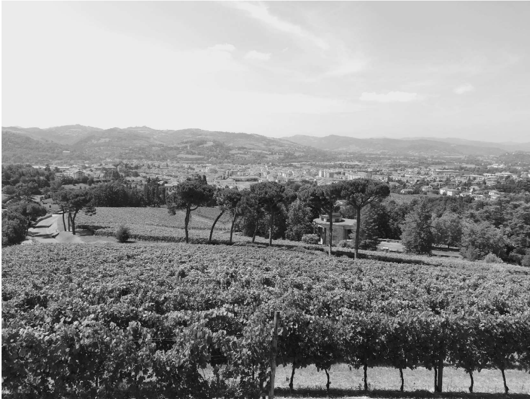
Fig. 3 Il paesaggio dell'acquese da Villa Ottolenghi Wedekind, Monterosso, Acqui Terme. Foto dell'autore 2020. - La «vigna-giardino e un bosco in un insieme architettonico» in relazione alla città di Acqui Terme e le colline dell'acquese sullo sfondo