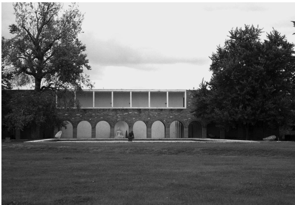
Fig. 1 G. Vaccaro, G. Cavani, Studi d'artista, Villa Ottolenghi Wedekind, Monterosso, Acqui Terme. Foto di Marco Ferrari 2019. - Si richiama in particolare l'attenzione sulle relazioni compositive ancora riconoscibili tra l'architettura razionalista e le opere scultoree «La Bagnante» di Herta Wedekind, collocata nella corte degli studi, e il «Tobiolo» di Arturo Martini, oggi sostituito da una copia nella medesima locazione al centro della piscina.