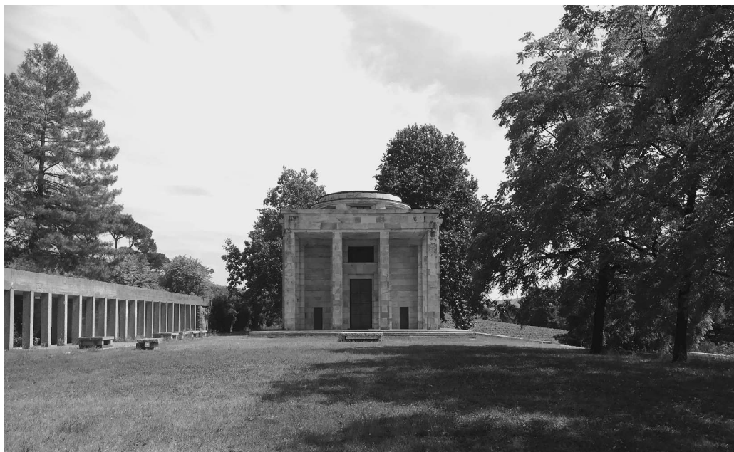
Fig. 2 M. Piacentini, E. Rapisardi, Mausoleo dei Conti Ottolenghi, Monterosso, Acqui Terme. Foto di Marco Ferrari 2020. – Su progetto di Piacentini, Ernesto Rapisardi segue il cantiere per la realizzazione del mausoleo. A partire dalla fine degli anni Cinquanta, egli ragiona il tracciamento architettonico della collina, la cui realizzazione – salvo per alcuni interventi circoscritti come ad esempio il porticato – non viene portata a termine, optando invece per l'approccio paesaggistico prospettato dal Porcinai.

terprete, consapevole della complessità di tale patrimonio. 12 Sulla collina di Monterosso ad Acqui Terme, i coniugi Arturo Ottolenghi ed Herta Wedekind patrocinano la creazione della loro casa per l'Arte, 13 in armonia con una «vigna-giardino e un bosco in un insieme architettonico», 14 attraverso numerose collaborazioni con noti artisti del panorama culturale del Novecento, del calibro di Marcello Piacentini, Ernesto Rapisardi, Giuseppe Vaccaro e Pietro Porcinai (Figg. 1 e 2). L'espressione «acropoli delle arti», 15 attribuita dalla critica a Villa Ottolenghi Wedekind, sintetizza al meglio l'eredità culturale del luogo, la sua vocazione, la rilevanza delle opere artistiche prodotte e soprattutto la valenza dei rapporti – funzionali, compositivi e percettivi – che ancorano la dimora al contesto territoriale (Fig. 3). Pietro Porcinai è l'autore di questi dialoghi con il paesaggio occupandosi, dal 1955 al 1970, della progettazione del giardino e della sistemazione del parco con un risultato tra i più significativi dei suoi interventi in area piemontese. La mano del paesaggista ricuce gli ambienti frammentati della tenuta, definendo un connettivo di eccellenza tra arte, architettura e paesaggio, attraverso un disegno di grande raffinatezza che si adatta e anzi valorizza i caratteri morfologici, rurali ed estetici del luogo (Fig. 4).