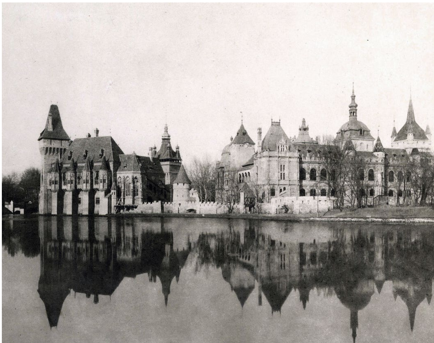
Fig. 2 - Il "Gruppo Storico" all'Esposizione del Millennario del 1896 a Budapest, veduta della sezione gotica e di quella rinascimentale, realizzate su progetto di Ignác Alpár (foto di György Klösz, 1900, Budapest Főváros Levéltára, Fortepan, ID 82019).

Segue la sezione gotica: il castello di Vajdahunyad con innestata la cappella di Csütörtökhely e lo scalone del castello di Keresd (già di gusto rinascimentale) 35 , la cosiddetta corte dei Cavalieri (Gotico di invenzione) in cui è collocata una fontana di Bratislava e s'innesta la torre di Segesvár, già rivolta al Rinascimento.