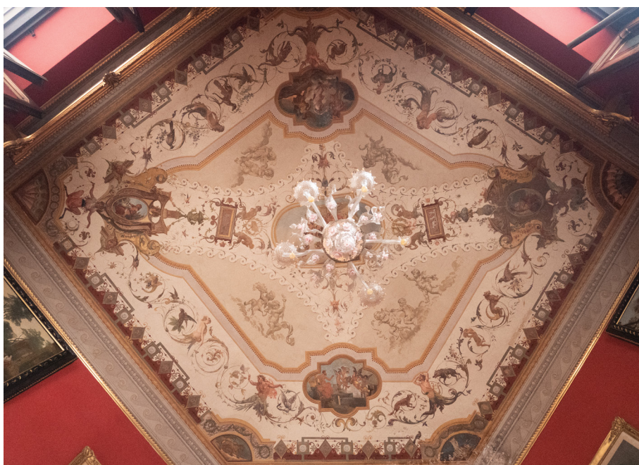
Fig. 16_Volta dell'ambiente pentagonale di palazzo Corbetta Bellini di Lessolo, 2023. La rappresentazione riprende il disegno del bozzetto conservato in archivio (MC_700b).