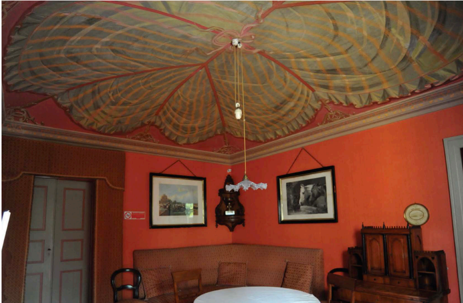
Fig. 14_Soffitto di un ambiente al I piano della villa reale, 2010. Il tema del drappeggio, seppur realizzato in cromie differenti, riprende la proposta presentata da Mossello per la realizzazione di un padiglione effimero (MC_696b).