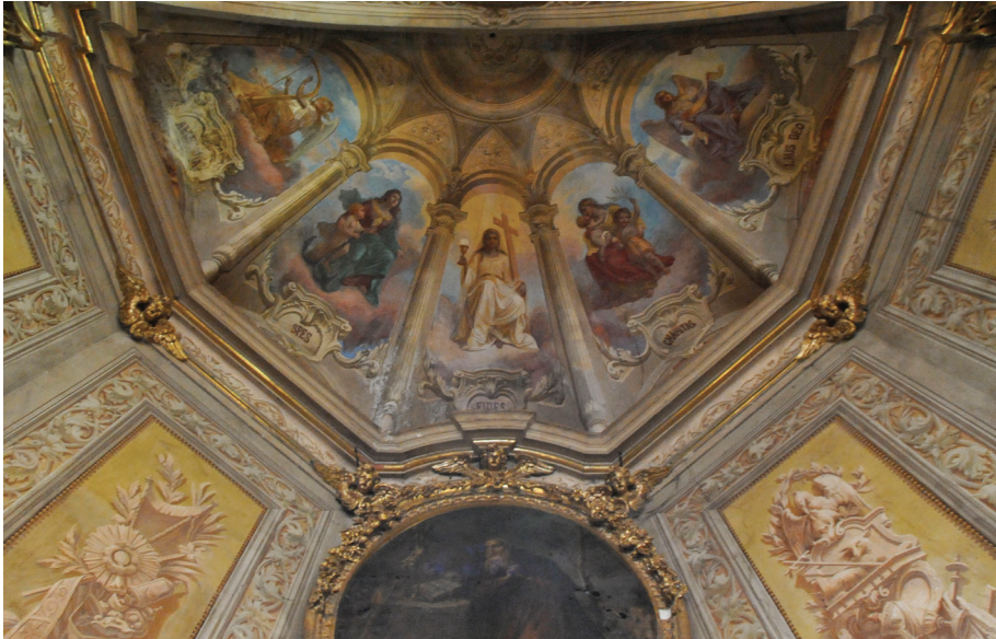
Fig. 10_Particolare dell'abside della chiesa di Sant'Antonio Abate, 2010. Il disegno riprende uno dei disegni di progetto conservati in archivio (MC_702a).