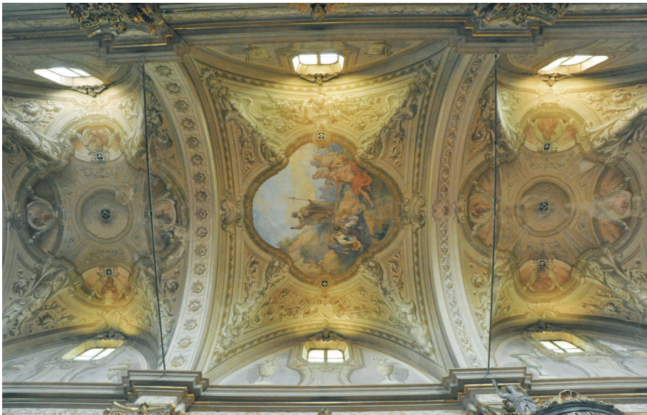
Fig. 11_Volta della navata centrale della chiesa di Sant'Antonio Abate, 2010. La rappresentazione riprende in parte i soggetti proposti nel bozzetto conservato in archivio (MC_702b).