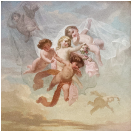
Fig. 2 Allegoria della primavera nella camera della duchessa d'Aosta Elena d'Orleans, 2023.