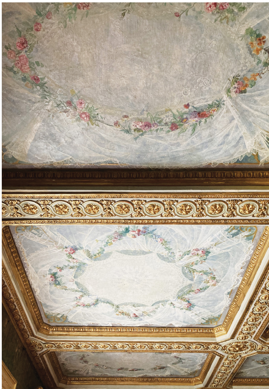
Fig. 5_Soffitto a cassettoni della Camera dell'Alcova, 2023. Il tema del drappeggio ancorato a ghirlande di fiori viene proposto negli otto riquadri perimetrali.