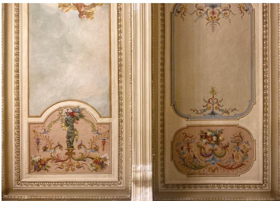
Fig. 18_ Particolare delle decorazioni realizzate per il salone centrale, ora sala dei concerti, dell'ex circolo sociale di Cuneo, 2023..