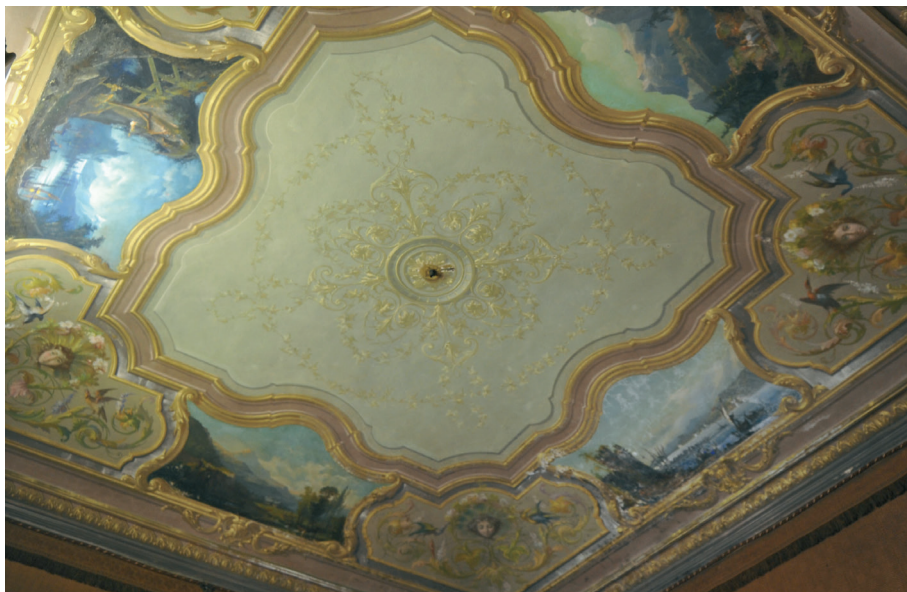
Fig. 8_Soffitto di un ambiente di villa Savoia Carignano, 2010 (foto di Dino Capodiferro). Le decorazioni riprendono uno dei disegni di progetto conservati in archivio (MC_697b).