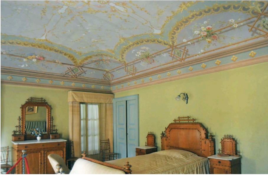
Fig. 12_Ambiente al II piano della villa reale di Fontanafredda, 2010.