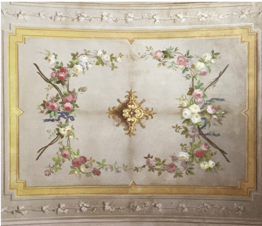
Fig. 4 Particolare della decorazione della volta del corridoio degli Uccelli , attribuibile all'operato dei Mossello, 2023.