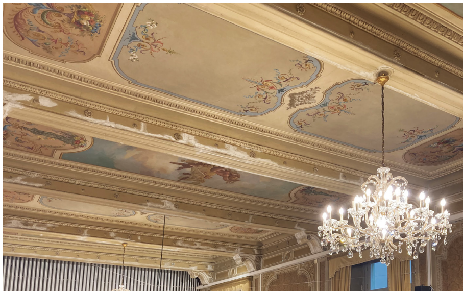
Fig. 17_ Il soffitto del salone centrale dell'ex circolo sociale di Cuneo, ora sede del conservatorio G. Ghedini, 2023.