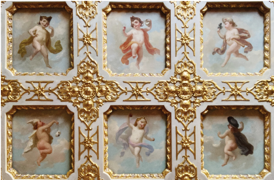
Fig. 1_Putti allegorici rappresentati nella Sala da ballo attribuibili ai Mossello, 2023.

scuri delle finestre, lungo le pareti del Corridoio degli Uccelli e nelle tempere delle porte» 11 .