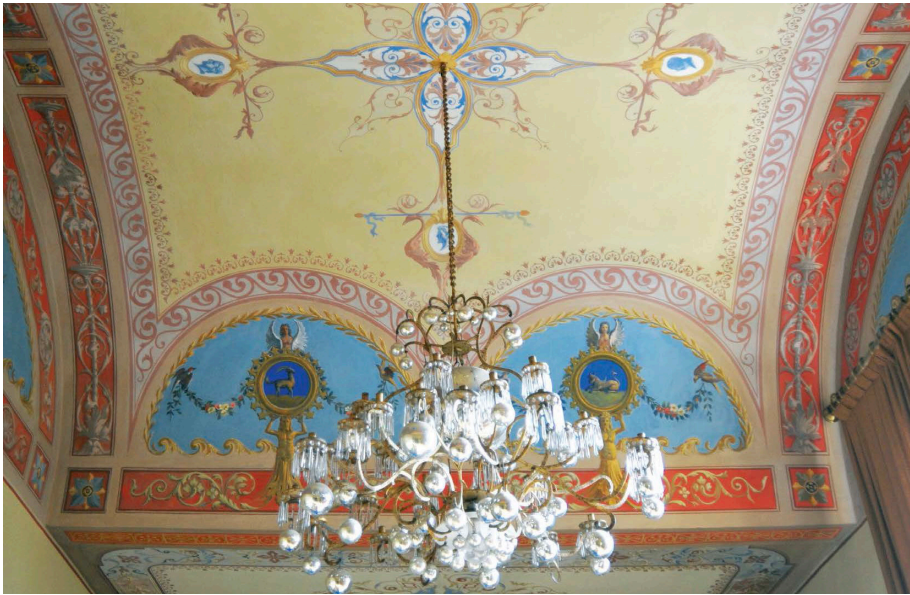
Fig. 13_Soffitto di un ambiente al IV piano della villa reale, 2010. Le decorazioni riprendono uno dei disegni di progetto conservati in archivio (MC_696a)