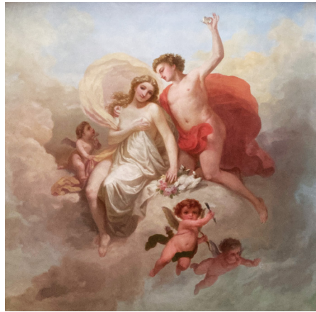
Fig. 3 Rappresentazione di Venere e Adone nella sala da gioco, 2023.