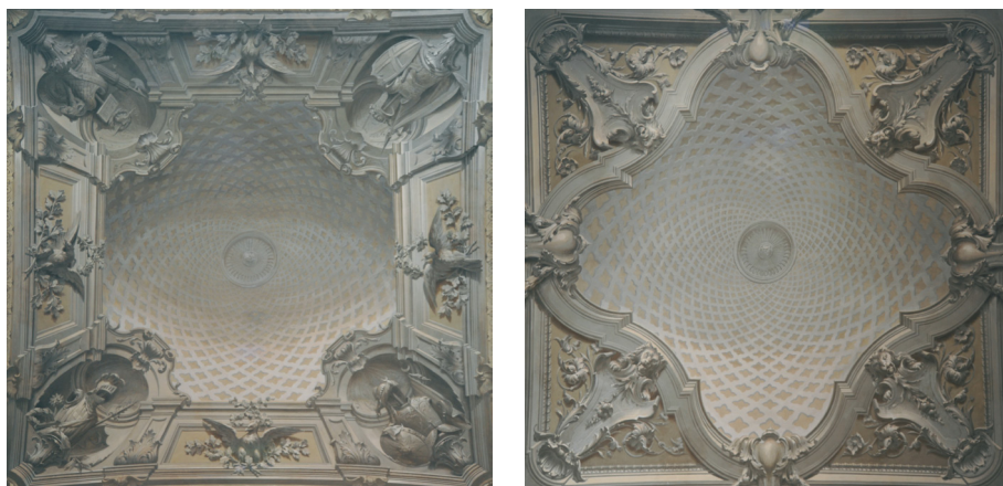
Fig. 6-7_Soffitti di due ambienti contigui al piano terra di villa Savoia Carignano, 2010.

luminosi ai quali fanno da sfondo idillici paesaggi campestri, accorte prospettive architettoniche» 22 , arricchiti da «pizzi e mazzi fioriti, veli, putti, raffigurazioni allegoriche e busti letterati» 23 . Temi e soggetti così ricorrenti nell'opera dei Mossello che, insieme alle firme degli autori e alla corrispondenza tra lo stato di fatto e i bozzetti, rendono abbastanza immediata l'individuazione di quanto sia effettivamente stato realizzato da loro. In particolare, al piano terra tra gli ambienti emergono l'androne (fig. 6-7), definito da due spazi voltati a vela con decorazioni in monocromo aderenti al disegno eseguito da Placido Mossello , e una seconda sala, caratterizzata da volte a vela ribassate, dove è rappresentato un ciclo pittorico raffigurante Le allegorie delle quattro stagioni firmato Domenico Mossello e datato 1877 (fig. 8). Al primo piano della villa si rilevano invece altre decorazioni attribuibili ai Mossello, una delle quali, caratterizzata da «un cielo luminoso solcato da un pergolato con elementi vegetali e delimitato da una quadratura circolare che presenta fasce di putti festanti, in monocromo con addobbi floreali» 24 , oltre a presentare la scritta Frat.lli Mossello all'imposta della volta, segue i colori e le forme indicati in uno dei tre disegni pervenuti 25 (fig. 9). Infine, il