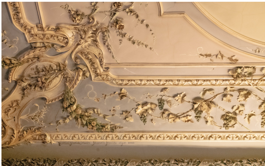
Fig. 15_Particolare della decorazione della volta della sala da pranzo di palazzo Corbetta Bellini di Lessolo, 2023. In basso a sinistra si legge la firma di Placido Mossello.