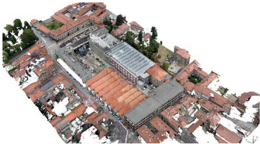
Fig. 3 - Mappa illustrativa dei legami urbanistici e architettonici dell'isolato relativo all'ex Lanificio Bona, sulla base delle esperienze condotte all'interno di Forma Urbana (elaborazione e rilievo urbano marzo 2023, a cura dell'autore).

Illustrative map of the urban and architectural links of the block relating to the former Bona Wool Mill, based on the experiences conducted within Forma Urbana (elaboration and urban survey March 2023, by the author).