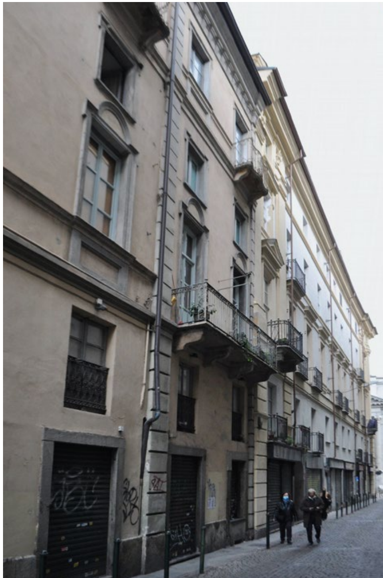
Figura 5. Torino. Palazzo Novarina di San Sebastiano, particolare del fronte su strada. Le due campate di destra sono frutto di una applicazione parziale del progetto vittoniano del 1767 (foto E. Piccoli, 2020).