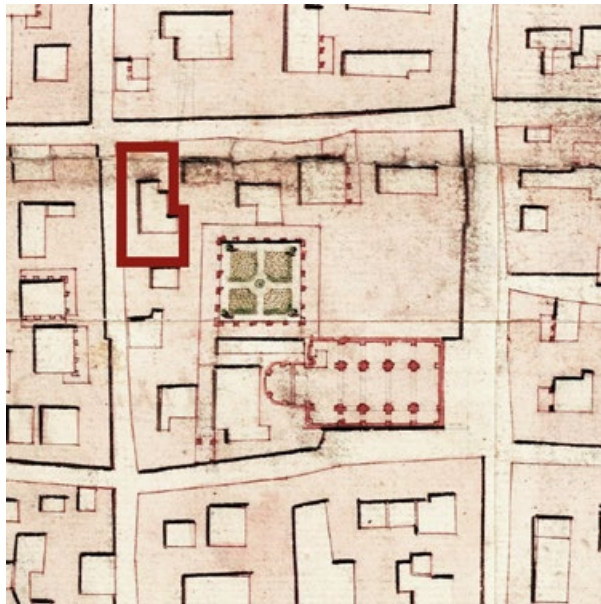
Figura 1. L'isola di San Tommaso intorno al 1765, con in evidenza la posizione della casa «dei Tre Citroni e Spada Reale». Dettaglio dalla Copia della Carta dell'Interiore della città di Torino che comprende ancora il Borgo di Po . AST, Corte, Carte topografiche per A e B, Torino 16, n. 1.

La transazione era soggetta a un intreccio di condizioni inconsuete, quasi un rebus. La casa si vendeva dietro pagamento immediato solo della metà del prezzo pattuito. Il saldo sarebbe stato corrisposto dopo 15 anni, e nel frattempo i Minori osservanti avrebbero versato ai Serviti interessi annui del 4% sulla somma ancora dovuta (in questo modo alla vendita si combinava un prestito tra le parti). In compenso, i Serviti sarebbero restati in possesso della casa «per cautella» e l'avrebbero affittata per conto dei nuovi (virtuali) proprietari. Dall'affitto riscosso 3 , i Serviti avrebbero direttamente trattenuto le spese di manutenzione e gli interessi del 4% a loro dovuti; il rimanente sarebbe stato affidato al Sindaco apostolico dei Minori osservanti che l'avrebbe tesaurizzato e riversato ai Serviti in